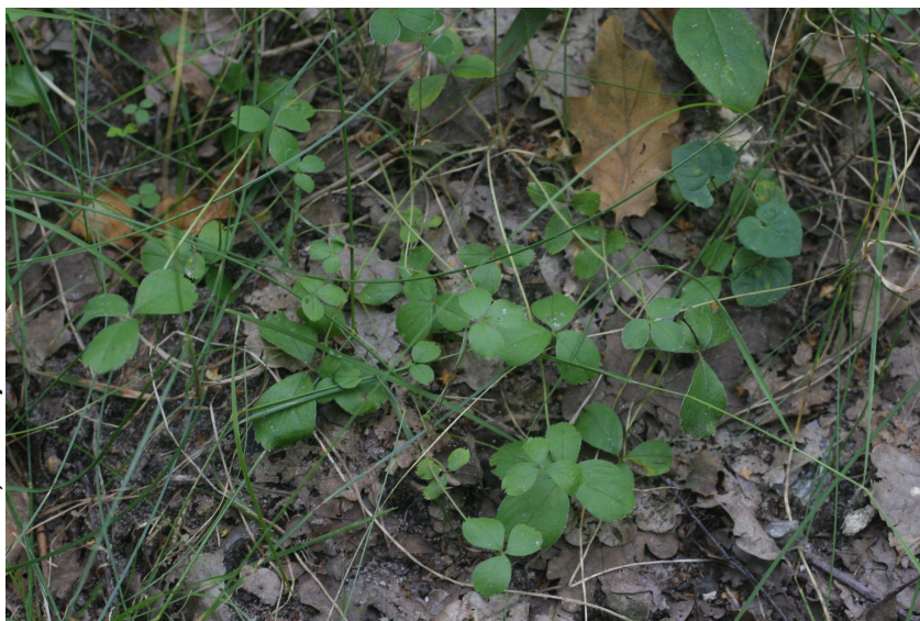
Station de Potentille des montagnes à Vétheuil.