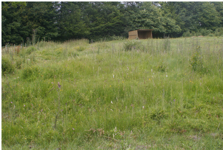
Aspect de la station de Troscart des marais en juin 2015

L'état de conservation du Troscart des marais dans la station peut être qualifié de favorable en raison de l'importance de l'effectif de la population et de l'état de conservation jugé favorable de son habitat. En revanche, le pacage précoce de la station peut constituer une menace active pesant à court terme sur la population.