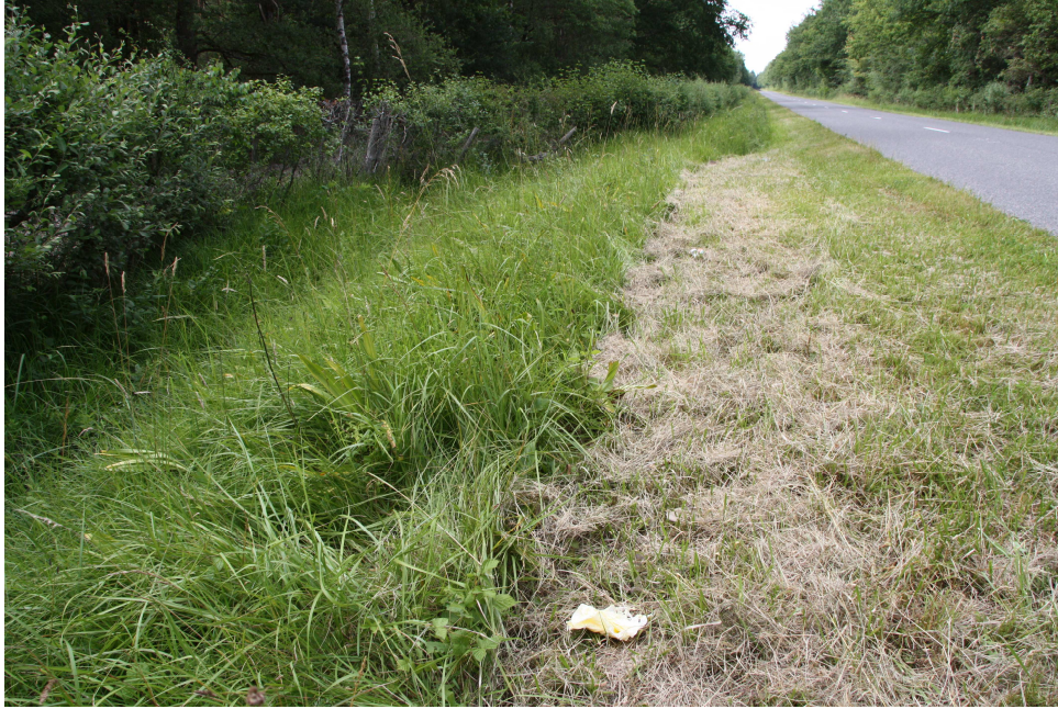
Aspect de la station à Sénéçon à feuilles spatulées à Vernou-la-Celle-sur-Seine en bord de route après une fauche sans exportation