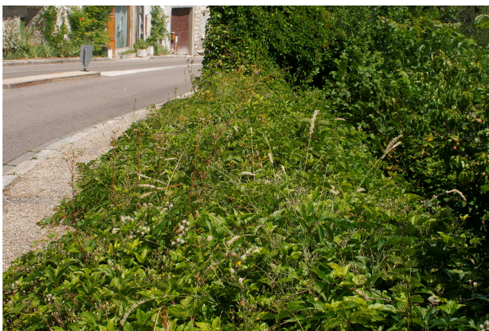
Station de Mélisque ciliée à La Roche-Guyon (XXXXXX) en contexte fortement anthropisé et menacée par l'envahissement par les arbustes (en particulier l'Ailante), en juillet 2015