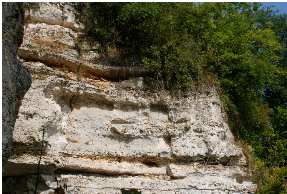
Aspect de la population de Mélique ciliée située en position naturelle, à la base d'un pinacle crayeux à Haute-Isle (XXXXXXD) en juillet 2015