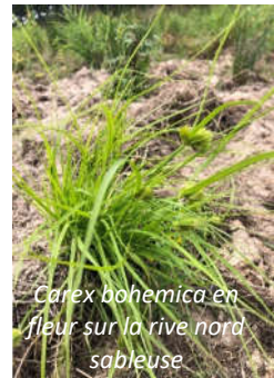
Carex bohemica en fleur sur la rive nord sableuse

L'ensemble des données produites ont pu être transmises à la fois au gestionnaire du site (Serge BOURDAIS de la FDC41), au CDPNE à l'origine de l'inventaire bryologique mené en 2022 (Aurélié POUMAILLOUX) et au Département de Loir-et-Cher (Direction de l'Aménagement et de la Mobilité). Par ailleurs, l'ensemble du formulaire ZNIEFF de type I a pu être mis à jour avec les données actualisées compilées en préparation de ce complément de connaissance 2023. Un nouveau passage après la remise en eau de l'étang et un marnage estival serait intéressant à prévoir pour mesurer le regain surfacique éventuel des gazons amphibiens sur sable. Une réflexion sur l'espacement des périodes d'asec a été discuté avec le gestionnaire pour éviter une trop forte progression durable des communautés de joncs. Enfin une veille sur les espèces de plantes à rechercher serait à maintenir pour compléter l'inventaire de la flore de cet ENS.