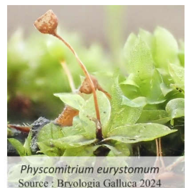
Physcomitrium eurystomum