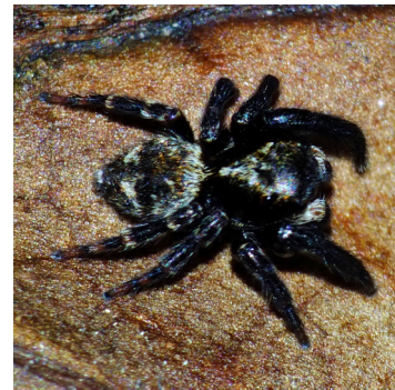
Mâle de Pseudeuophrys erratica vue de face (haut) et vue dorsale (bas)

Le mâle de Pseudeuophrys erratica est beaucoup plus petit que le mâle d' Hasarius adansoni . Les bandes blanches présentes sur le céphalothorax et sur l'abdomen sont moins marquées que chez Hasarius adansoni (il en est de même pour la bande rougeâtre).