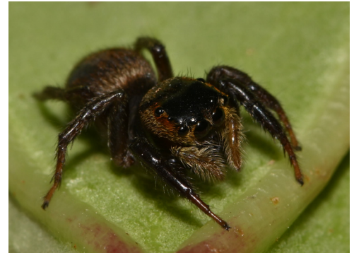
Femelle d' Hasarius adansoni

Les Salticidae, communément appelées « araignées sauteuses », sont reconnaissables grâce à leur céphalothorax (partie antérieure de l'animal) de forme rectangulaire. Elles se distinguent également par le positionnement de leurs yeux : les quatre antérieurs tournés vers l'avant (les deux médians de taille plus importante que les latéraux), les quatre postérieurs, plus en arrière sur deux lignes.