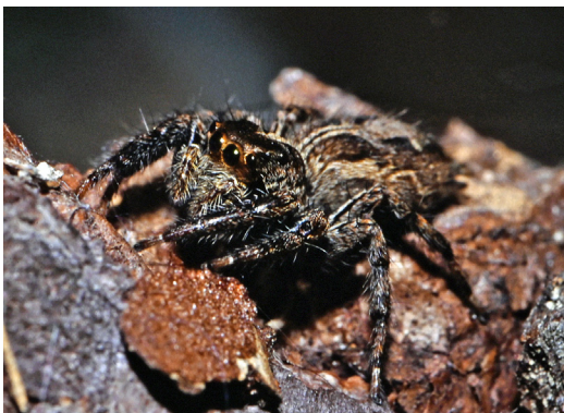
Femelle de Plexippus paykulli