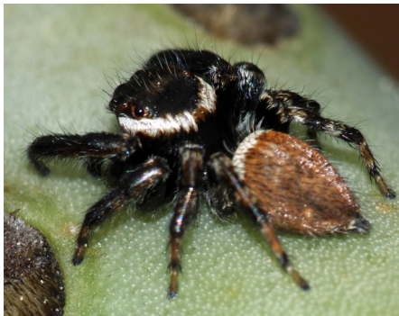
Mâle d' Evarcha jucunda vue de face (haut) et vue dorsale (bas)

Le mâle d' Evarcha jucunda est de taille similaire et présente des critères très semblables à celui d' Hasarius adansoni . Ce qui permet de les différencier sont les pédipalpes projetés vers l'avant chez Evarcha jucunda alors qu'ils sont croisés chez Hasarius adansoni .