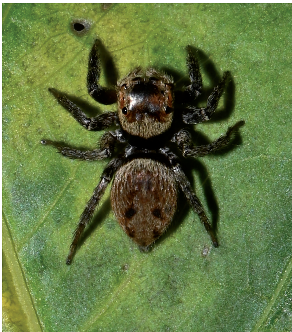
Figure 2.- Habitus d'une femelle d' Hasarius adansoni.

Noter sur les photos de face (B, D, F) la différence de longueur et disposition des soies blanches sur les palpes et sur les photos de dos (A, C, E) l'arc de soies blanches sur l'arrière du céphalothorax, continu pour H. adansoni , discontinu pour E. jucunda et absent pour P. erratica .