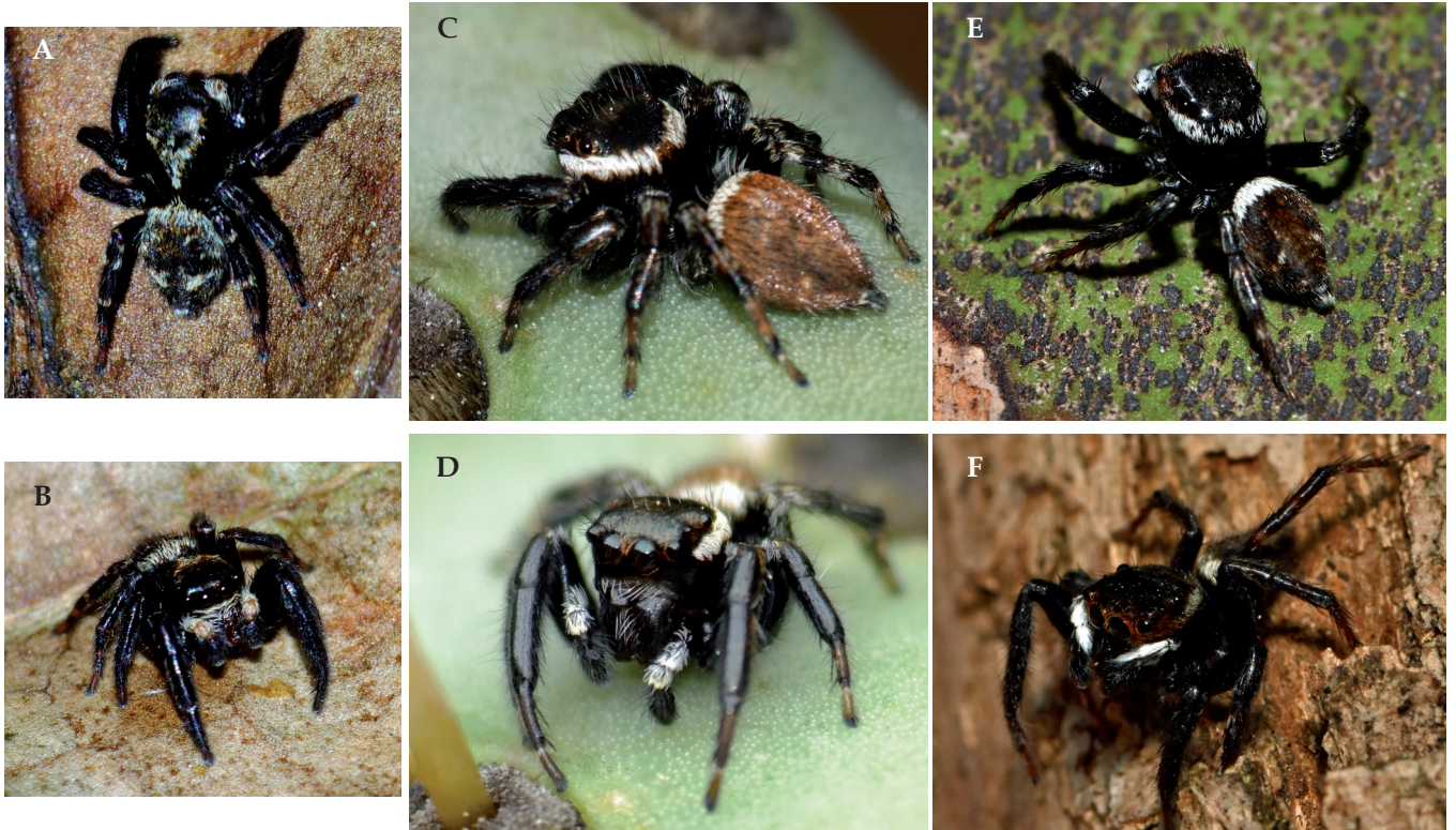
Figure 1.- Planche comparative entre les mâles d'espèces proches : AB , Pseudeuophrys erratica ; CD , Evarcha jucunda ; EF , Hasarius adansoni ; ACE , vues dorsales ; BDF , vues de face (photos : Yvan Montardi).

Noter sur les photos de face (B, D, F) la différence de longueur et disposition des soies blanches sur les palpes et sur les photos de dos (A, C, E) l'arc de soies blanches sur l'arrière du céphalothorax, continu pour H. adansoni , discontinu pour E. jucunda et absent pour P. erratica .