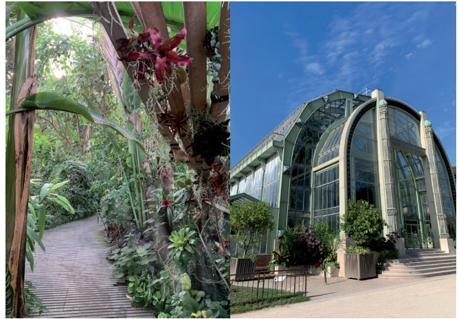
Figure 3.- Serres du Jardin des plantes du Muséum national d'Histoire naturelle de Paris.

Seine-et-Marne : Melun, appartement, 1 mâle, VII-2023, leg. C. Jacquet.