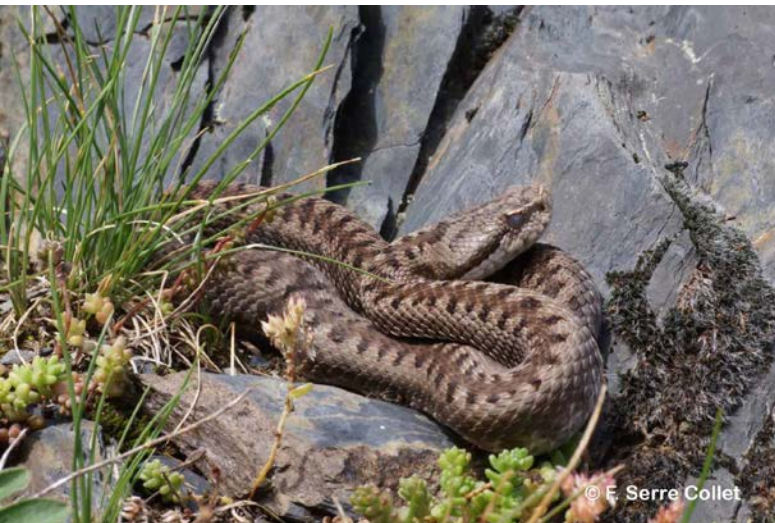
Vipera aspis zinnikeri Kramer, 1958