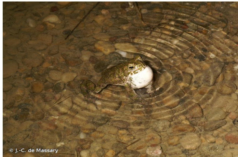
Bufo viridis viridis (Laurenti, 1768)