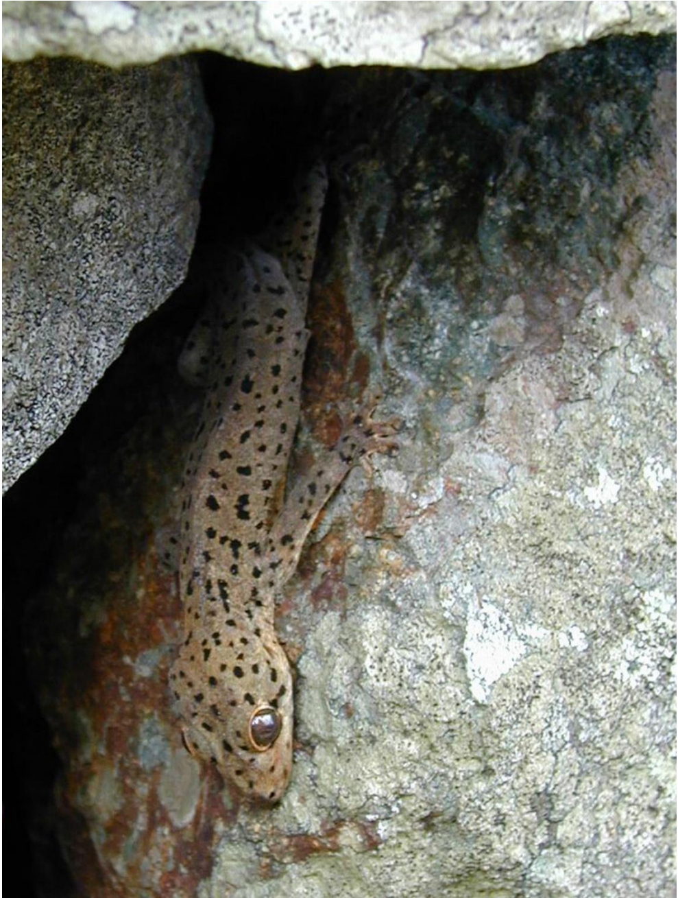
Figure 5 : Thecadactylus oskrobapreinorum , une espèce de Gecko endémique de Saint-Martin, photographié dans son habitat naturel à la Loterie Farm en avril 2004.

Figure 5: Thecadactylus oskrobapreinorum , an endemic Gekkonid species of Saint Martin, photographed in its natural habitat, at Loterie Farm in April 2004.