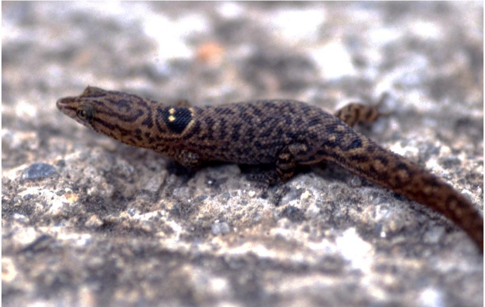
Sphaerodactylus parvus King, 1962 Le Sphérodactyle de Saint-Martin.