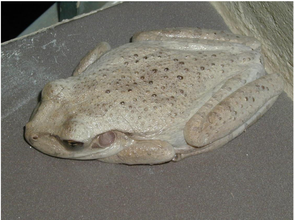
Figure 3 : Osteopilus septentrionalis , une espèce de Rainette introduite à Saint-Martin, photographiée ici à Marigot en mars 2004.

Lors du passage de l'un d'entre nous (JL) à Saint-Martin en novembre 1983, on ne parlait pas de la présence d'une Rainette dans les arbres à Saint-Martin. Peu après, une Rainette trouvée dans la partie néerlandaise de l'île en 1987 a été identifiée par erreur comme Oolygon rubra (= Scinax ruber ) et citée sous ce nom dans Schwartz et Henderson (1991). Elle a été re-déterminée comme Osteopilus septentrionalis et mentionnée sous son vrai nom par Powell et al. (1992). Cet Hylidé a été ensuite observé par Breuil (2002) dans plusieurs localités de la partie française en 1996 ; il y est très répandu maintenant (Yokohama 2012).