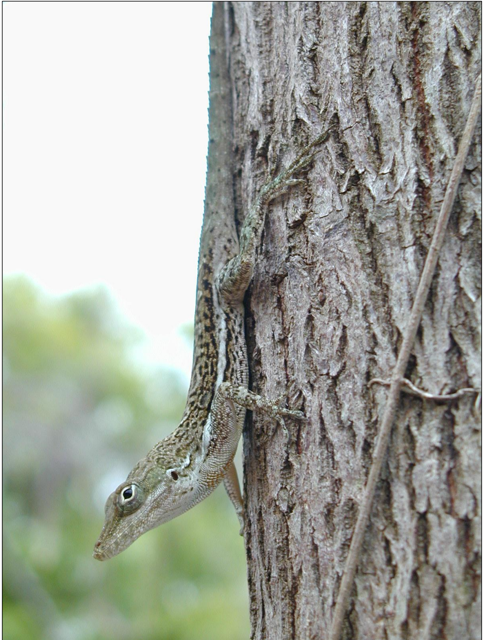
Figure 4 : Anolis gingivinus , photographié à Saint-Martin, Loterie Farm en avril 2005.