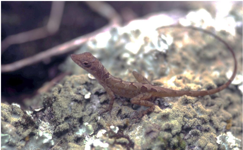
Anolis pogus Lazell, 1972 L'Anolis de Saint-Martin.