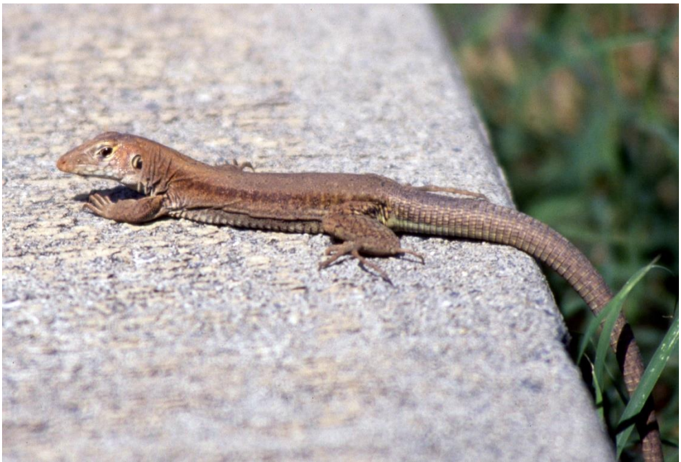
Pholidoscelis plei (Duméril & Bibron, 1839) L'Ameive de Plée (jusq' à récemment dans le genre Ameiva ).