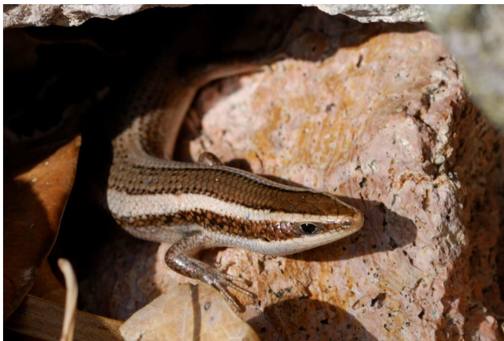
Figure 3 : Spondylurus powelli , photographié à Saint-Barthélemy, Morne de Grand Fond, en juillet 2008.

Nous conservons le nom de genre Spondylurus déjà employé pour les Scinques du Banc d'Anguilla (voir Massary et al. 2017).