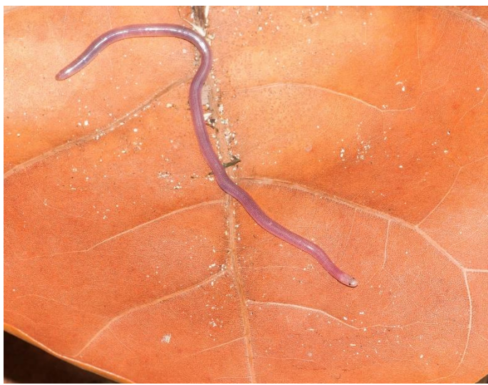
Figure 6 : Antillotyphlops annae , photographié à Saint-Barthélemy, Morne de Grand Fond, en décembre 2014.

Antillotyphlops est un nouveau genre décrit par Hedges et ses collaborateurs (2014) dans une révision phylogénétique globale des Typhlopides. Le Typhlops de Saint-Barthélemy, Antillotyphlops annae (Fig. 6), est la seule espèce endémique de l'herpétofaune de Saint-Barthélemy.