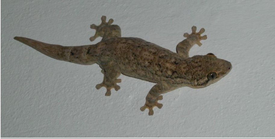
Figure 4 : Thecadactylus rapicauda , photographié à Saint-Barthélemy, Port de Gustavia, en juin 2005.

présent sur les Thecadactylus (voir Kronauer et al. 2005) ne permettent pas de préciser le statut spécifique de l'ensemble des populations des Petites Antilles, notamment du Banc d'Anguilla.