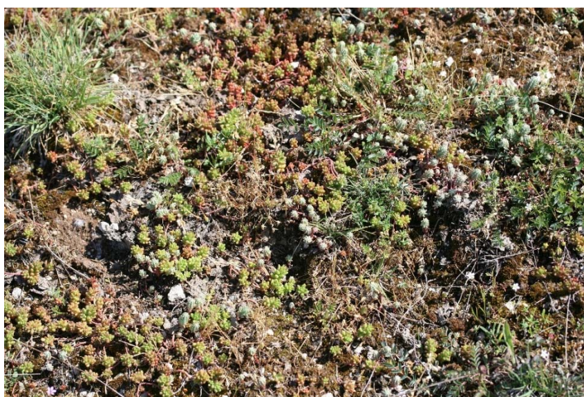
Festuco auquieri – Sedetum ochroleuci ( Alyso alyssoidis – Sedion albi ), Dordogne