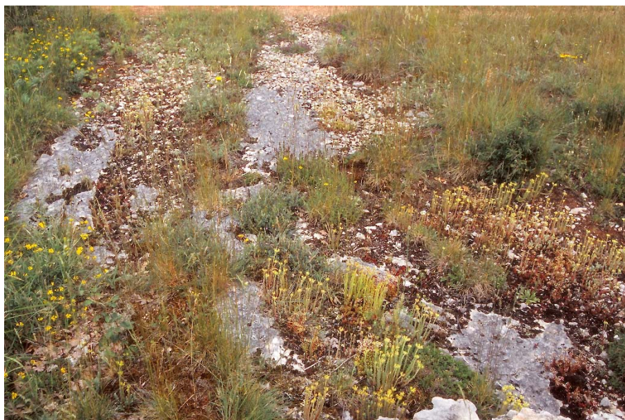
Festuco auquieri – Sedetum ochroleuci ( Alyso alyssoidis – Sedion albi ), Lot

4) Des régions de Belgique et d'Allemagne, cet habitat est étroitement lié aux associations du Xerobromion et du Mesobromion .