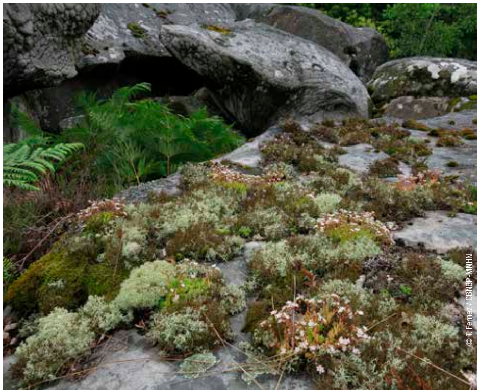
Végétation de dalle du Sedion anglici sur chaos gréseux, HIC 8230.

les difficultés scientifiques qui restent attachées à la conception actuelle des habitats. Le caractère fixiste des typologies rend notamment difficile la prise en compte du niveau de dégradation des habitats, et pose la question de leur mise à jour régulière. La problématique du biais inter-opérateur sur l'identification des habitats, mis en évidence par un projet de recherche (L. Maciejewski, UMS PatriNat), affecte la fiabilité des données d'inventaire ; le rôle important alloué aux experts induit en outre un enjeu de pérennisation des savoirs. Le rôle des connectivités écologiques, la complémentarité entre