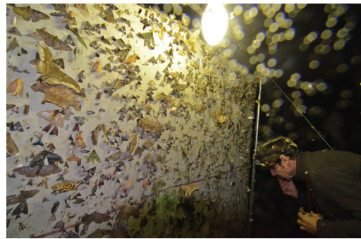
Piège lumineux à insectes.

Rappelons pour conclure que ces cartes sont produites à partir de données d'observations qui ont été numérisées, consolidées et transférées dans des systèmes de bases de données informatiques partiellement partagées. Si la pratique s'est fortement développée depuis 2010, une part importante des observations naturalistes dorment encore dans les carnets personnels et les collections : tous les zoologistes n'ont pas la même propension à contribuer aux systèmes d'information numériques, et donc à documenter leurs zones d'études. Pister les pisteurs reste encore dans ce cas une tâche complexe, voire impossible.