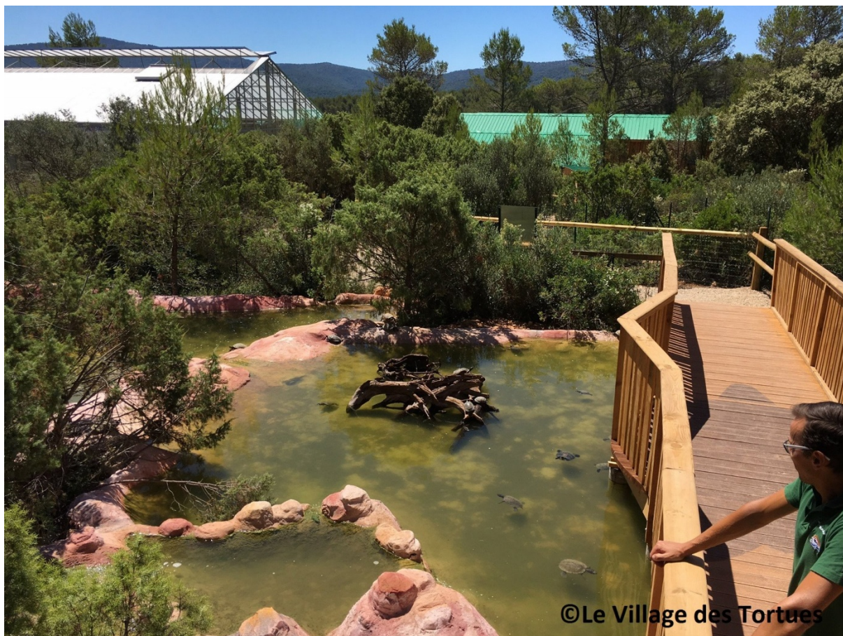
Figure 5 : Village des Tortues à Carnoules