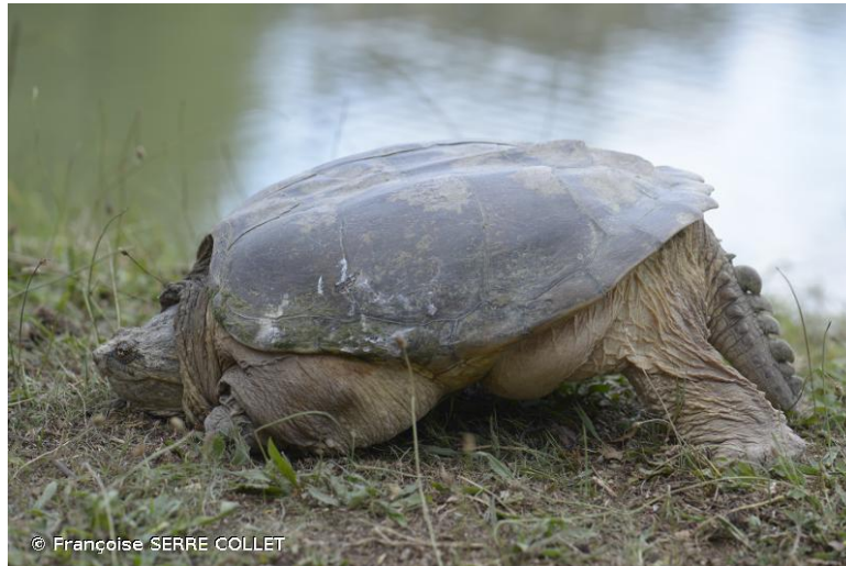
Figure 3 : Adulte observé dans le milieu naturel

La Tortue serpentine Chelydra serpentina (Linnaeus, 1758) (Fig.3), une tortue de grande taille et classée dangereuse (arrêtés du 10 août 2004 et du 08 octobre 2018) est originaire de l'Est des Etats-Unis au Sud du Canada. Elle a été introduite en France métropolitaine. Des populations sont présentes en Gironde, en Haute-Garonne et dans le Gard (Maucarré 2016). L'espèce n'est pas considérée invasive en France en raison d'un manque de connaissance de ses impacts sur l'environnement. Selon la liste rouge mondiale de l'Union Internationale pour la Conservation de la Nature (IUCN), la tendance des populations est stable. Cependant, le braconnage et le commerce qu'elle subit pourrait mettre en péril l'espèce. La Tortue serpentine a été évaluée par le COSEPAC comme « espèce préoccupante et inscrite en annexe 1 de la Loi sur les espèces en péril au Canada » (Environnement et Changement climatique Canada 2016, COSEPAC 2008).