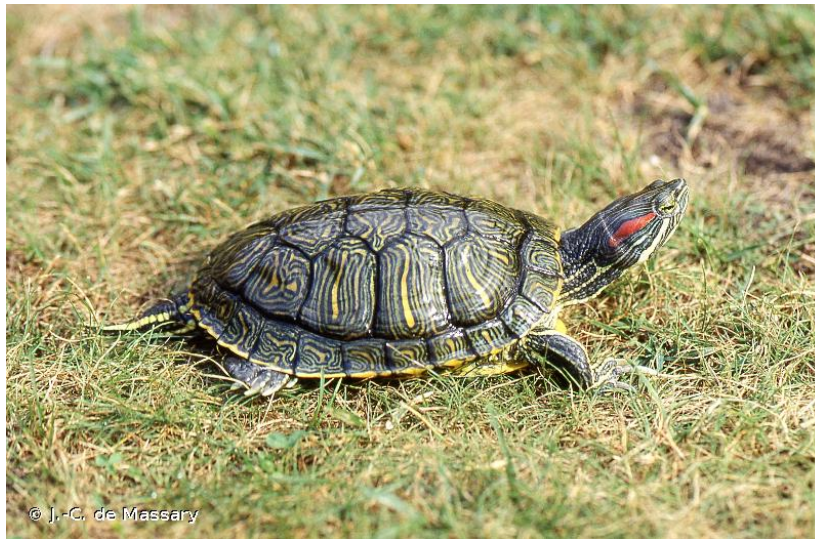
Figure 1 : Adulte de Tortue à tempes rouges, dite Tortue de Floride.

La Tortue de Floride (Fig.1), ou Tortue à tempes rouges Trachemys scripta elegans (Wied, 1839), originaire du continent américain a été importée et vendue en Europe dans les années 80 comme Nouvel Animal de Compagnie (NAC).