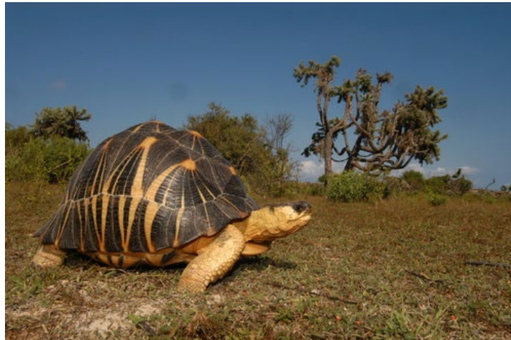
Figure 4 : Adulte dans son habitat, Madagascar

La Tortue rayonnée Astrochelys radiata (Shaw, 1802) (Fig.4) originaire de Madagascar, n'est pas une espèce invasive mais elle est braconnée dans son aire de répartition naturelle ou vendue sur internet, comme animal de compagnie. Elle est même braconnée en dehors de son aire naturelle de répartition car elle figure parmi les tortues les plus volées dans les jardins, parcs, et chez les particuliers qui la possèdent légalement (l'espérance de vie de ces tortues est bien plus longue que leur ancienneté d'inscription à la CITES, les exemplaires légaux sont donc souvent de vieux individus, donc de grande taille, donc se vendant très cher au marché noir).