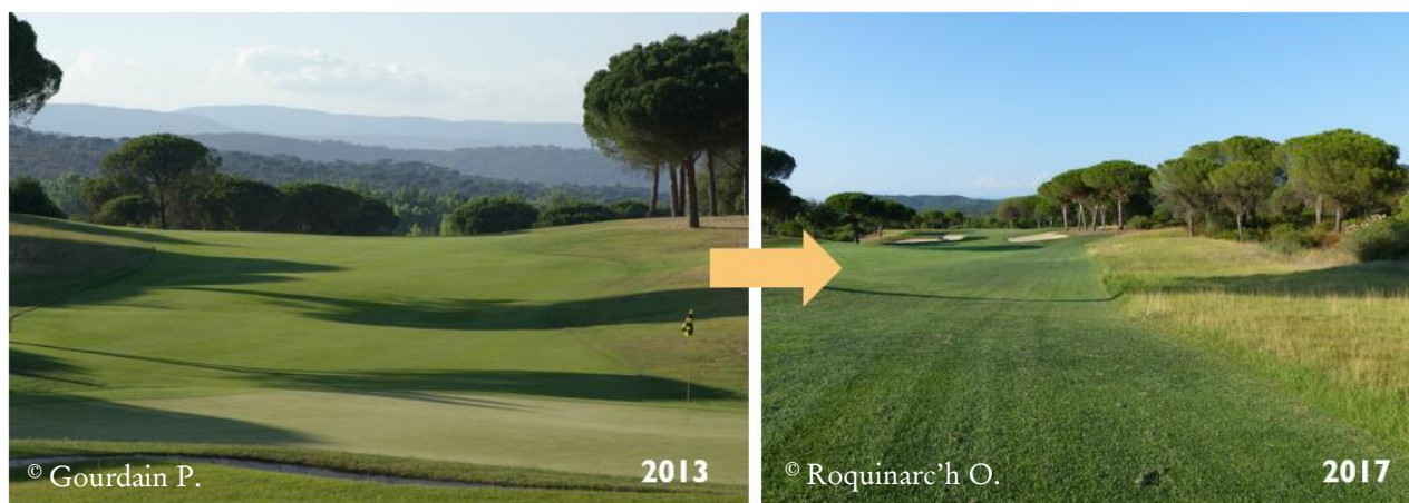
Figure 1 : Golf de Viduban – Choix des stations de hauts roughs.

Concernant l'étude des continuités écologiques, le site d'étude est un ensemble de sites de captage d'eau potable. Ces sites clôturés correspondent aux périmètres de protection immédiate des captages et sont principalement constitués de pelouses sèches ou de prairies de fauche ( Figure 2 ). 35 stations ont été échantillonnées en 2018 et 34 en 2019 (un des sites n'étant plus accessible).