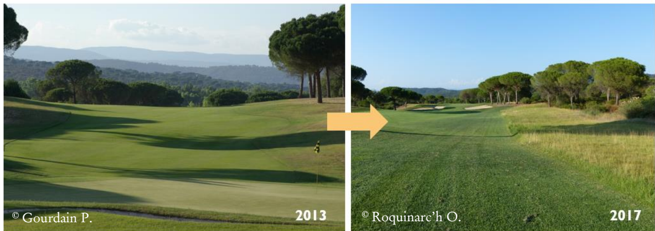
Figure 1 : Golf de Vidauban – Choix des stations de hauts roughs.

Concernant l'étude des continuités écologiques, le site d'étude est un ensemble de sites de captage d'eau potable. Ces sites clôturés correspondent aux périmètres de protection immédiate des captages et sont principalement constitués de pelouses sèches ou de prairies de fauche ( Figure 2 ). 35 stations ont été échantillonnées en 2018 et 34 en 2019 (un des sites n'étant plus accessible).