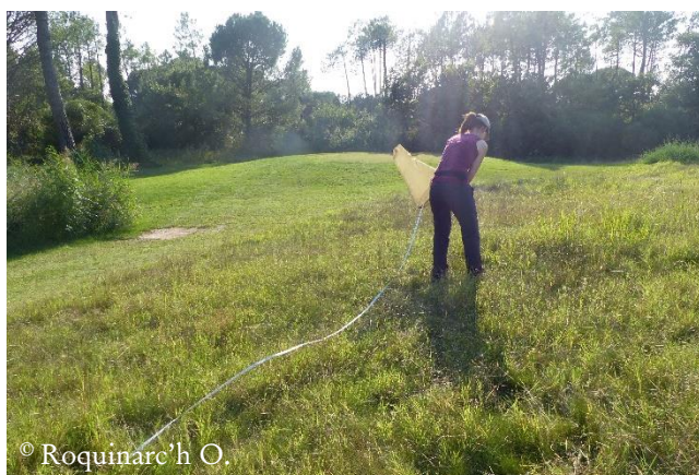
Figure 4 : Application de l'indice linéaire d'abondance (ILA) dans un haut rough.

L'Indice Linéaire d'Abondance (ILA) selon la méthode de Voisin (1986) consiste à parcourir des trajets linéaires (ou transects) d'une longueur de 20 m, établis à l'aide d'un double décimètre. Il est important de s'assurer que ces transects ne soient pas trop près les uns des autres et ne se recoupent pas. Selon la taille de la station, le nombre de trajets peut être adapté. Le nombre de spécimens fuyant devant les pas de l'observateur est comptabilisé sur une bande d'une largeur environ égale à un mètre (Jaulin, 2009). La distance de 20 m est respectée grâce à une corde, ou une ficelle, que l'opérateur fait glisser entre ses doigts ou attache à sa ceinture (Figures 4 et 5). Durant ces trajets, tous les individus sont identifiés et comptabilisés. Dans le cas des spécimens de détermination délicate, ils sont capturés pour être identifiés à la fin du trajet puis relâchés sur place.