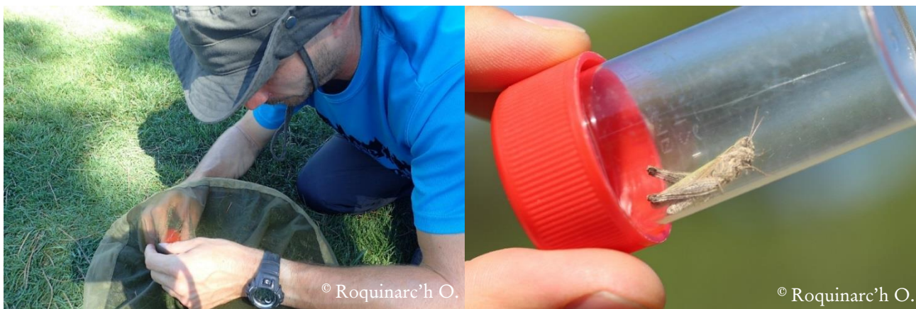
Figure 3 : Identification d'un spécimen suite à une capture au filet (à gauche) puis à l'aide d'une boîte d'observation (à droite).

Durant les inventaires, l'identification des spécimens a été effectuée à vue et/ou à l'ouïe et/ou par capture-relâché grâce à un filet à papillon (Figure 3). Elle a été réalisée grâce à une clé de détermination, principalement à partir du guide d'identification de Sardet et al. (2015). Des clés régionales peuvent aussi être utiles. Lors des relevés, une attention particulière a été portée au comptage des individus afin d'éviter les doubles comptages.