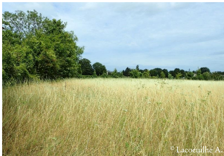
Figure 2 : Etude des continuités écologiques – Stations constituées principalement de milieux herbacés.

Concernant l'étude des continuités écologiques, le site d'étude est un ensemble de sites de captage d'eau potable. Ces sites clôturés correspondent aux périmètres de protection immédiate des captages et sont principalement constitués de pelouses sèches ou de prairies de fauche ( Figure 2 ). 35 stations ont été échantillonnées en 2018 et 34 en 2019 (un des sites n'étant plus accessible).