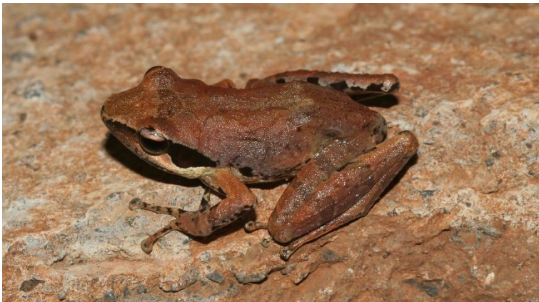
Figure 3 : Blommersia transmarina , femelle adulte photographiée à Mayotte, dans l'« Écoparc » au sud-est de Sada, mars 2008.

Figure 2: Boophis nauticus , adult male photographed in Mayotte, in the “Ecoparc” southeast of Sada, March 2008.