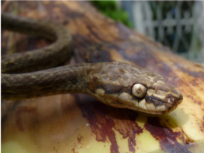
Figure 5: Lycodryas maculatus comorensis , adult female, photographed in Mayotte, Lac Combani, in April 2019.