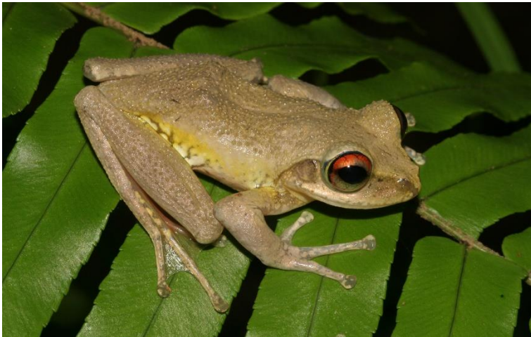
Figure 2 : Boophis nauticus , mâle adulte photographié à Mayotte, dans l'« Écoparc » au sud-est de Sada, mars 2008.

La Tortue imbriquée, Eretmochelys imbricata , se reproduit et s'alimente aussi à Mayotte, mais elle y est beaucoup moins présente, seules quelques dizaines d'individus sont vues chaque année. On observe aussi dans les eaux du département quelques Dermochelys coriacea , Caretta caretta et Lepidochelys olivacea , mais on ne les a pas vues s'y reproduire (Ballorain 2010). La Tortue caouanne, Caretta caretta , est vue sur les tombants ou au niveau des passes (Vickel com. pers. à Ciccione in Ciccione & M'Soli 2012).