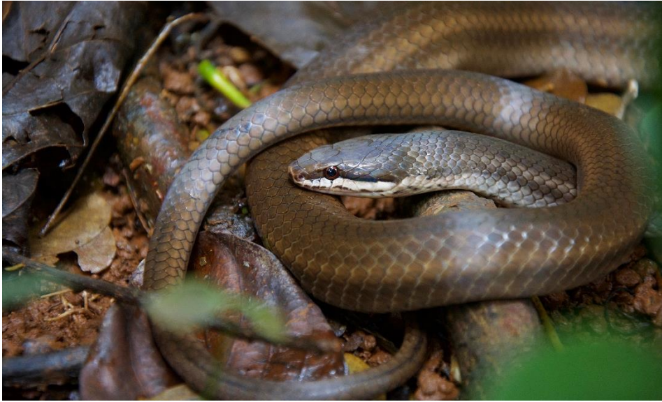
Figure 7 : Liophidium mayottensis , photographié à Mayotte, Lac Karihani, mars 2019.

Figure 7: Liophidium mayottensis , photographed in Mayotte, Lac Karihani, March 2019.