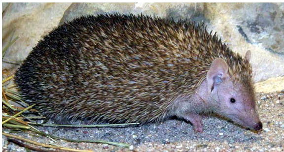
Figure 3 : Petit Tenrec Hérisson ( Echinops telfairi ). Cette espèce ressemble à s'y méprendre à un hérisson. Pourtant, leur ancêtre commun pourrait avoir vécu il y a plus de 105 millions d'années.

D'importantes convergences morphologiques entre espèces de petits Mammifères, liées en particulier à des modes de vies ou des régimes alimentaires similaires, ont généré une grande confusion dans leur classification. Ainsi, les zoologistes ont longtemps classé dans l'ordre des Insectivores des espèces qu'ils croyaient apparentées, leur régime alimentaire étant en effet composé en grande partie d'Arthropodes, mais aussi d'autres invertébrés, ce qui leur conférait une dentition analogue. Cet ordre, aujourd'hui invalidé, regroupait les musaraignes, les taupes, les hérissons, les solénodontes, les tenrecs et les taupes dorées. Des études génétiques ont montré par la suite que les tenrecs, bien que ressemblant beaucoup (voire à s'y méprendre dans le cas du Petit Tenrec-hérisson Echinops telfairi , Fig. 3) aux hérissons ou aux musaraignes, et les taupes dorées, au mode de vie proche des autres taupes, étaient en fait très éloignés de ceux-ci d'un point de vue phylogénétique : ils ont été regroupés dans l'ordre des Afrosoricides. Les musaraignes, les taupes et les solénodontes ont été regroupés un temps dans l'ordre des Soricomorphes et les hérissons dans l'ordre des Erinaceomorphes. Aujourd'hui, la tendance est de regrouper les musaraignes, les taupes, les solénodontes et les hérissons dans l'ordre des Eulipotyphles, comme l'ont proposé Waddell et al. (1999).