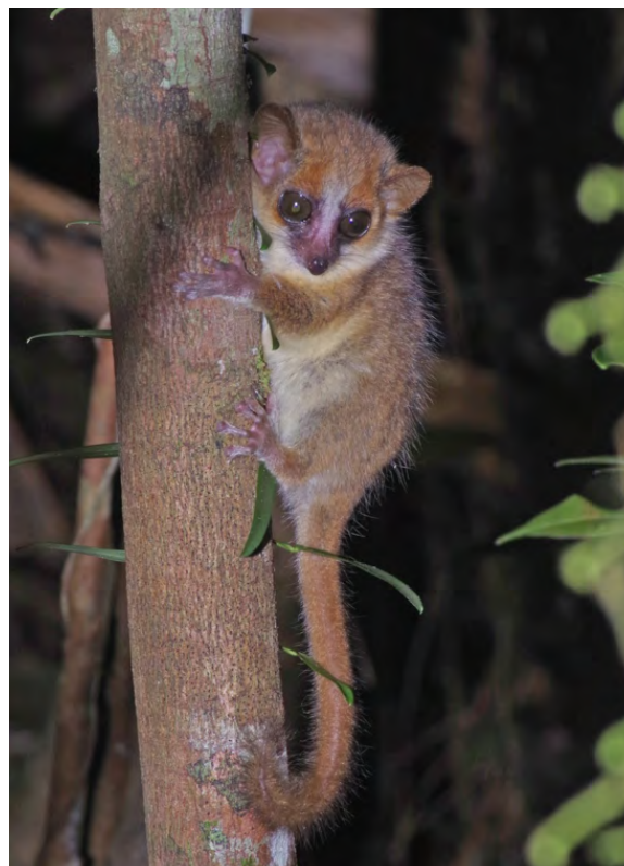
Figure 1 : Le Microcèbe de Goodman ( Microcebus lehilahytsara ), un Primate de la famille des Cheirogaleidés, ne pèse pas plus de 48 g.

Les francophones, Canadiens compris (voir par exemple Desrosiers et al. 2002), sont, semble-t-il, les seuls à utiliser la notion de « micromammifère ». Son usage est bien établi et il semble difficile de le faire disparaître au profit de « petit Mammifère ». Implicitement, on a tendance à qualifier ainsi les Mammifères non volants d'une taille proche de celle des souris à l'état adulte, susceptibles d'être trouvés dans les pelotes de chouettes (en particulier l'Effraie des clochers Tyto alba ) ou d'être capturés par des pièges-cages ou pièges-boîtes de petite dimension (modèle INRA par exemple). Dans la pratique, il s'agit d'espèces dont le poids n'excède pas 100 g en moyenne. Si on s'en tient à notre définition, un Hérisson d'Europe ( Erinaceus europaeus ) est un petit Mammifère mais pas un micromammifère (Fig. 2).