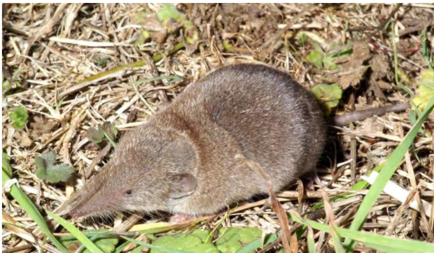
Figure 6 : La Crocidure musette ( Crocidura russula ), un petit Mammifère arrivé spontanément en France métropolitaine durant l'Holocène, il y a 6000 ans environ, à partir de la péninsule Ibérique.

La Musaraigne endémique de Corse : Episoriculus corsicanus (Bate, 1944) La Siciste des bouleaux : Sicista betulina (Pallas, 1779) Le Campagnol de Cabrera : Microtus cabrerai Thomas, 1906 Le Campagnol grêle : Microtus gregalis (Pallas, 1779) Le Campagnol de Male : Microtus malei Hinton, 1927 Le Campagnol nordique : Microtus oeconomus (Pallas, 1776) Le Mulot endémique corso-sarde : Rhagamys orthodon (Hensel, 1856) Le Campagnol endémique corso-sarde : Tyrrhenicola henseli (Forsyth Major, 1882) Le Lapin rat : Prolagus sardus (Wagner, 1829)