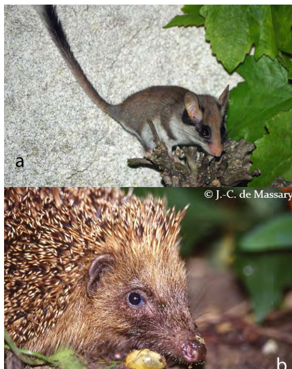
Figure 2 : Deux exemples de petits Mammifères. a : Lérot ( Eliomys quercinus ) ; b : Hérisson d'Europe ( Erinaceus europaeus ). Seul le Lérot peut être qualifié de micromammifère.