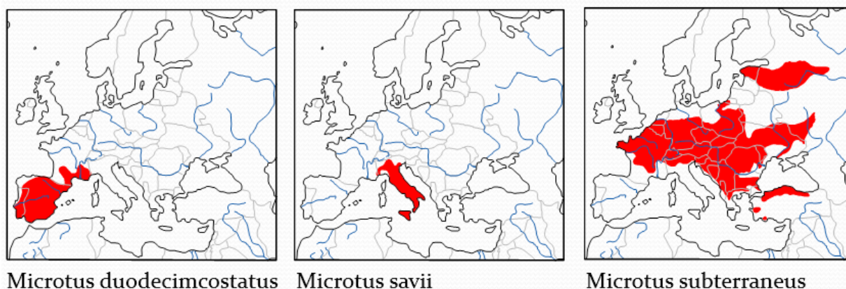
Figure 5 : Aires de répartition de 3 espèces de Microtus (sous-genre Terricola ) présents en France et originaires de différents refuges glaciaires quaternaires. M. duodecimcostatus : péninsule ibérique, M. savii : péninsule italienne, M. subterraneus : péninsule balkanique. D'après Aulagnier et al. 2007.