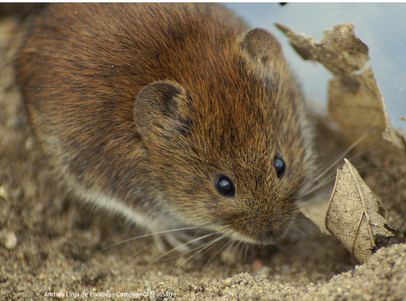
Campagnol roussâtre