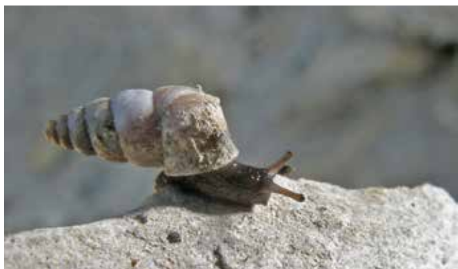
■ Le Maillot de Saorge ( Solatopupa psarolena ), une espèce alpine classée "Vulnérable"

Pour d'autres, la pression des aménagements touristiques ou le piétinement dû à la surfréquentation de certains sites constituent une menace. C'est le cas par exemple pour la Caragouille des Dunes, classée "En danger", ou la Fausse-veloutée du Ventoux, classée "En danger critique".