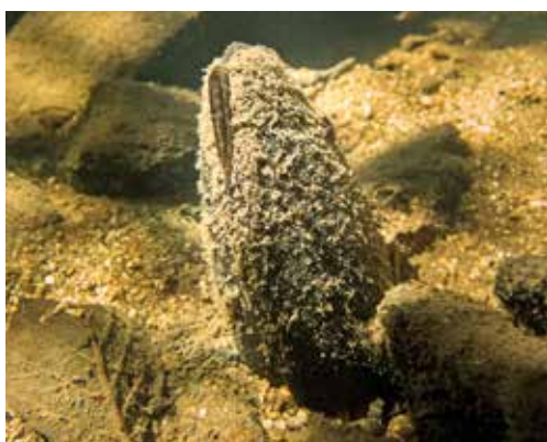
■ La Mulette perlière ( Margaritifera margaritifera ), connaît un fort déclin et apparaît "En danger"