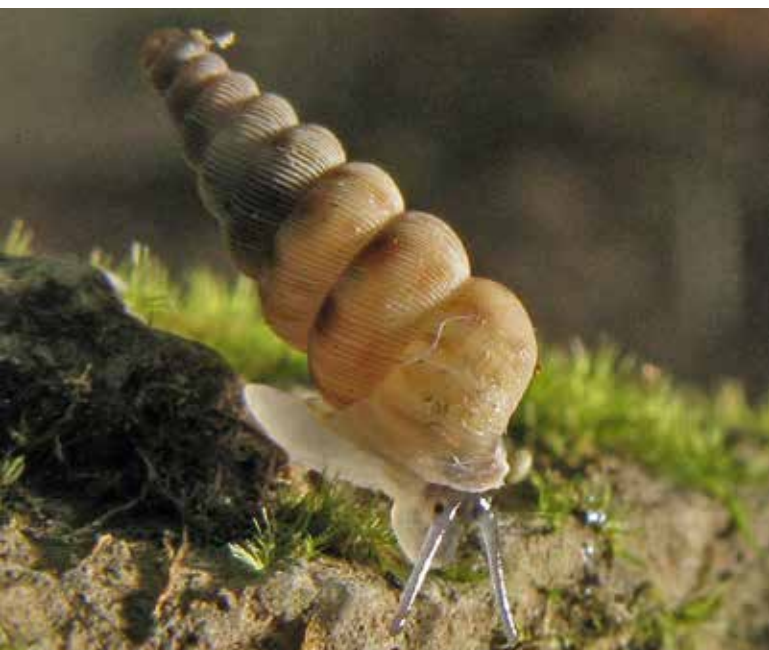
■ Le Cochlostome de la Giandola ( Cochlostoma acutum ), vivant dans la vallée de la Roya et classé "Vulnérable"

Au total, 726 espèces sont recensées en France au sein des groupes examinés, parmi lesquelles 35 n'ont pas été soumises à l'évaluation et ont été affectées à la catégorie "Non applicable". Cette situation concerne les espèces non natives, introduites en France métropolitaine dans la période récente (après l'année 1500), comme la Mercurie trompette ou la Planorbine voyageuse. Parmi ces espèces, certaines sont devenues envahissantes et représentent une menace pour la faune locale, telles que la Corbicule asiatique et l'Anodonte chinoise.