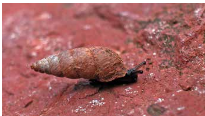
■ Le Maillot des pétilites ( Solatopupa cyanensis ), classé "Quasi menacé" © Olivier Gargominy

(δ) X : espèce endémique de France métropolitaine.