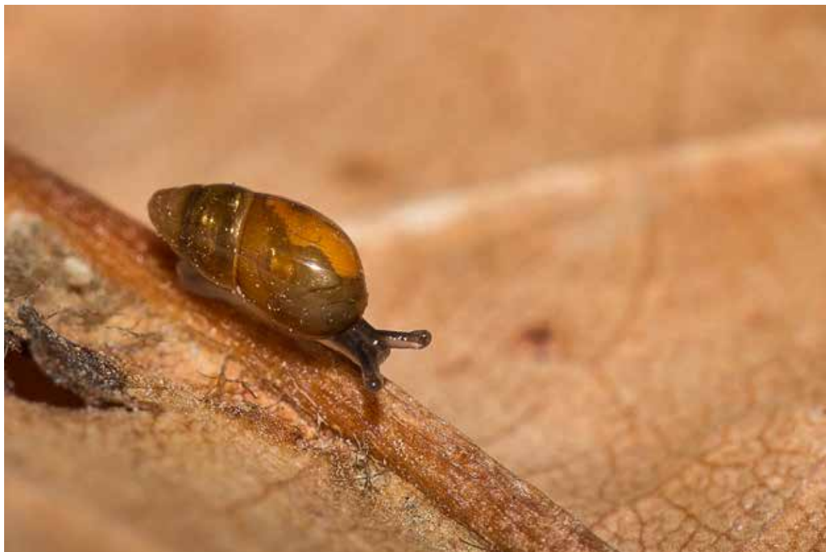
■ La Brillante minuscule ( Cryptazeca monodonta ), espèce forestière endémique des Pyrénées, classée "Quasi menacée"