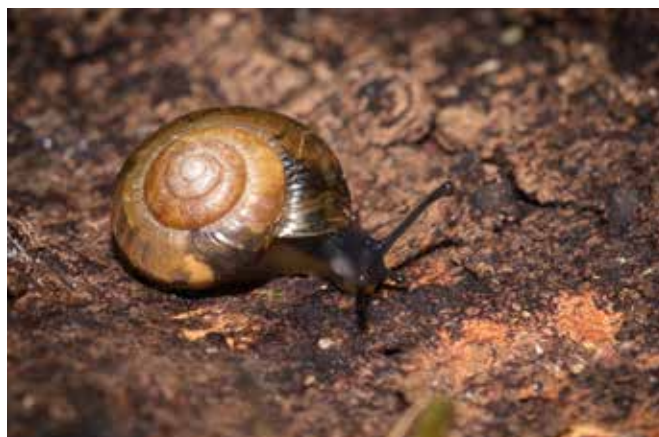
■ L'Hélice molle ( Zenobiellina subrufescens ), classée en catégorie "Données insuffisantes"

L'évaluation a été menée par le Comité français de l'UICN et l'UMS PatriNat (OFB-CNRS-MNHN). Elle a mobilisé les connaissances de spécialistes, qui ont apporté leur contribution à la phase préparatoire de compilation et de vérification des données, ainsi qu'à l'établissement des analyses préliminaires. Onze d'entre eux ont ensuite participé à la validation collégiale des résultats lors d'un atelier organisé sur une semaine en juillet 2020. Une catégorie a alors été attribuée à chacune des espèces selon la méthodologie de l'UICN. Les résultats ont été consolidés conformément au référentiel taxonomique national TaxRef.