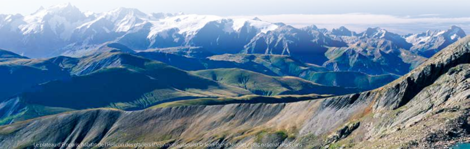
Le plateau d'Emparis, habitat de l'Hélicon des glaciers ( Delphinatia glacialis )

(δ) X : sous-espèce endémique de France métropolitaine.