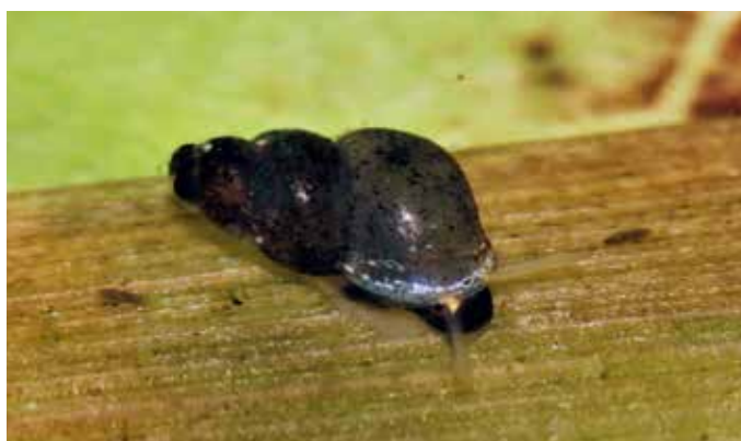
■ La Fausse-bythinelle bretonne ( Marstoniopsis armoricana ), classée en catégorie "En danger"