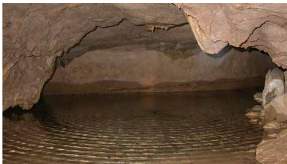
■ Un certain nombre d'espèces de gastéropodes vivent dans les eaux souterraines de sources ou de cavernes

(δ) X : espèce endémique de France métropolitaine.