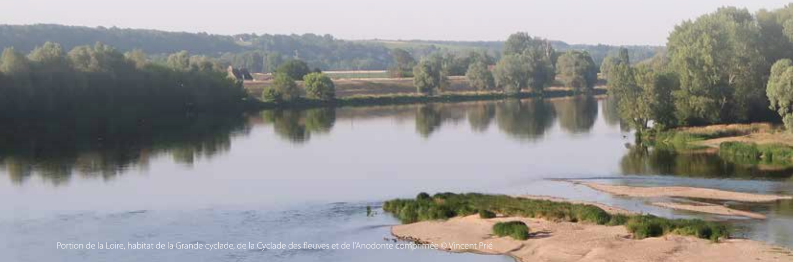
Portion de la Loire, habitat de la Grande cyclade, de la Cyclade des fleuves et de l'Anodonte comprimée

D'autre part, les pollutions issues de l'agriculture ou dues aux rejets d'eaux usées ont un impact important pour les espèces inféodées aux milieux humides. La Mulette perlière et la Limnée cristalline, toutes deux classées "En danger", font partie de celles-ci.