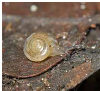
■ La Cristalline des Alpes-Maritimes ( Vitreola pseudotrollii ), une espèce "En danger" © Olivier Gargominy