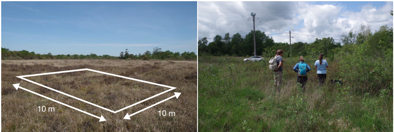
FIG. 4. — Exemples de relevés effectués sur des placettes délimitées de 100 m 2 en landes humides (d'après Mistarz & Grivel 2020).

met de calibrer la méthode en attribuant les valeurs seuils et notes associées aux indicateurs retenus pour intégrer la méthodologie. Pour atteindre ces objectifs, sont réalisés sur les sites prospectés :