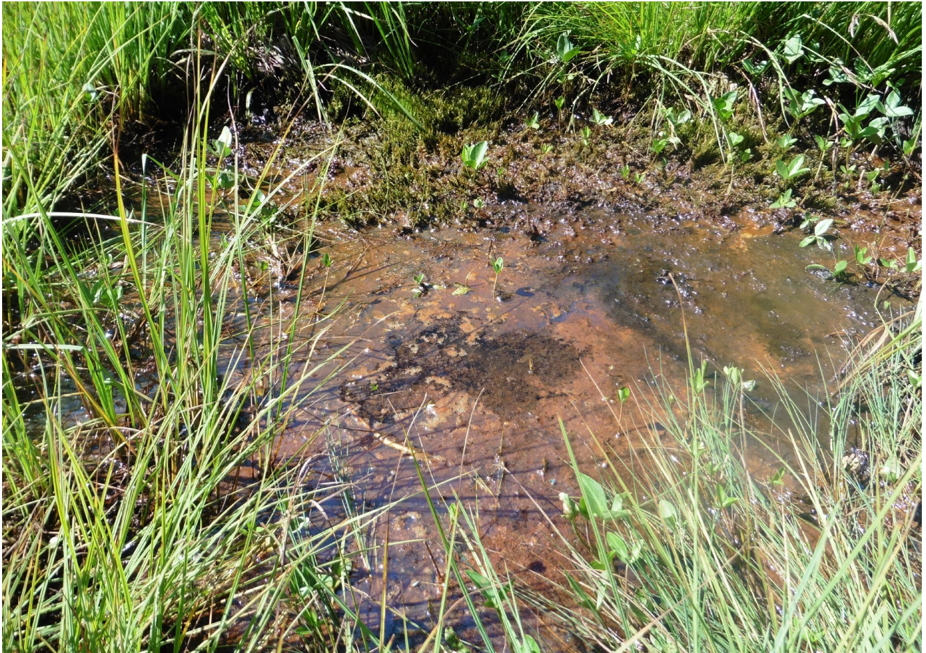
Fig. 1. — «Lacs et mares dystrophes naturels», habitat d'intérêt communautaire présent sur le territoire métropolitain (UE 3160).

listées en Annexe II ( inpn.mnhn.fr , dernière consultation le 12 janvier 2021). En 2017, le réseau Natura 2000 couvrait 12,9 % du territoire métropolitain terrestre et un tiers de la surface marine, soit 1 776 sites (ZPS et ZSC) (Peters & Von Unger 2017). L'article R414-11 du Code de l'environnement (Anonyme 2008) notifie l'évaluation de l'EC des HIC et EIC pour chaque site Natura 2000. Il constitue ainsi une transposition de la DHFF dans le droit français. Les résultats de l'évaluation doivent être retranscrits dans le Document d'objectifs du site (DOCOB), qui permet de fixer les objectifs de conservation de la biodiversité et de gestion à l'échelle de chaque site.