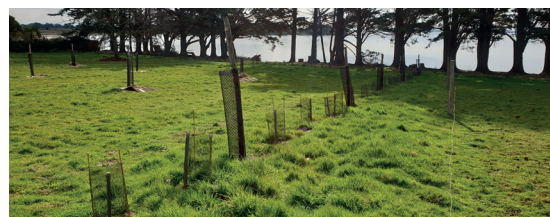
Figure 4 : Photographies de sites participants aux AMI, de gauche à droite, en haut : pelouse du PNR Vercors (P. d'Adamo, 2019), mare du PNR du Luberon (D. Tatin, 2020), en bas : prairie du PNR Lorraine (C. Bernard, 2020), haie du PNR du Golfe du Morbihan (C. Bernard, 2021)