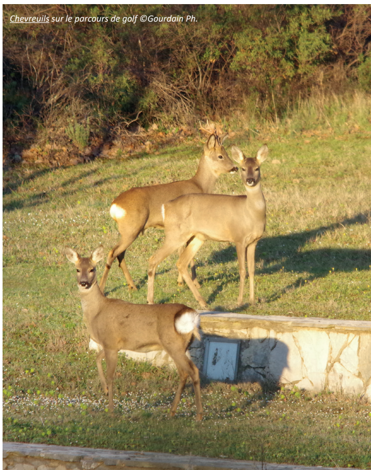
Chevreaux sur le parcours de golf