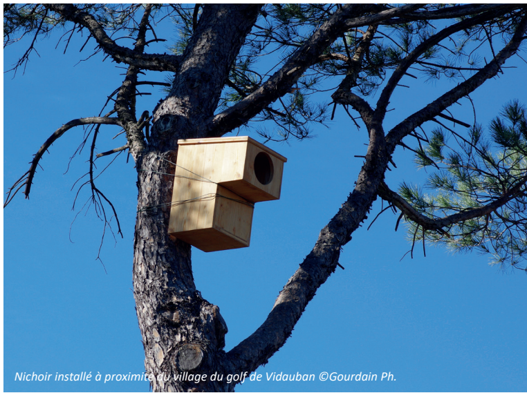
Nichoir installé à proximité du village du golf de Vidauban