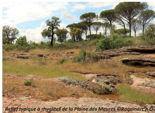
Relief typique à rhyolites de la Plaine des Maures

Dans le cadre de cette étude, de nombreuses perspectives sont identifiées. Cela peut notamment ouvrir des perspectives en termes de nouvelles pratiques d'études de terrain, associant écologues et géologues. Il serait également intéressant de mener des réflexions sur l'intérêt de l'approche géologique, et dans quelle mesure cette dernière pourrait permettre d'anticiper les dynamiques écologiques à venir, que ce soit en termes de gestion des sites ou de conservation du patrimoine naturel sur les sites.