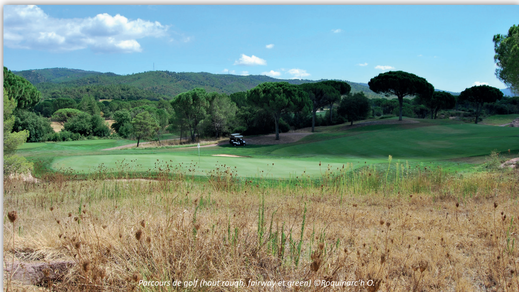
Parcours de golf (haut rough, fairway et green)