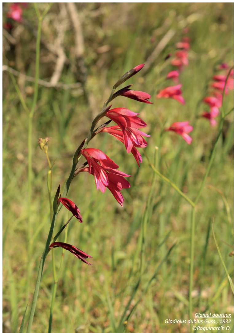
Glaïeul douteux Gladiolus dubius Guss., 1832 ©Roquinarç'h O.