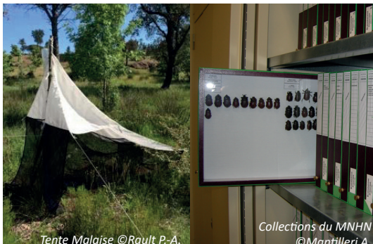
Tente Malaise

L'inventaire en cours est, à ce titre, tout à fait exceptionnel !