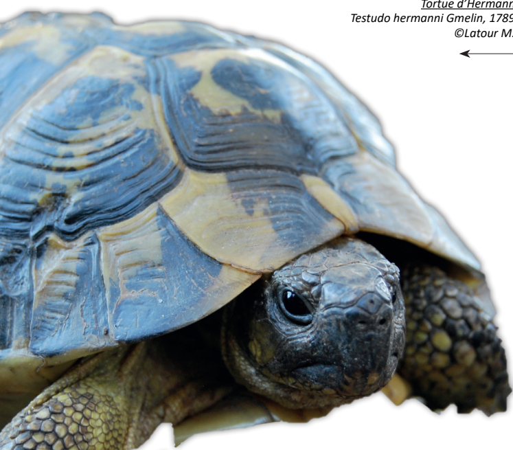
Tortue d'Hermann Testudo hermanni Gmelin, 1789

La mise en œuvre de ces recommandations et de mesures volontaires additionnelles a permis d'améliorer significativement l'accueil de la biodiversité sur le parcours . Parmi elles : la réduction importante de la largeur des fairways (tondus ras), remplacés par des semi-roughs et hauts roughs plus favorables à la biodiversité, l'installation de nichoirs, l'extinction d'une partie de l'éclairage nocturne du hameau, ainsi que la végétalisation des bassins artificialisés.