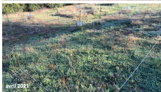
Evolution d'une placette semée entre décembre 2018 et avril 2021