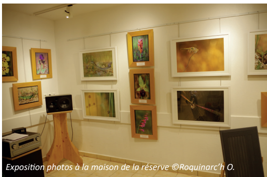
Exposition photos à la maison de la réserve

La Fondation dispose d'une exposition itinérante de photos, qu'elle propose aux médiathèques, établissements scolaires et lieux grand public locaux. Une exposition s'est tenue pendant 4 mois à la maison de la nature des Mayons (RNN Plaine des Maures). 1 200 visiteurs ont découvert l'exposition basée sur les photos du livre de la Fondation « Le Petit Peuple des Maures ».