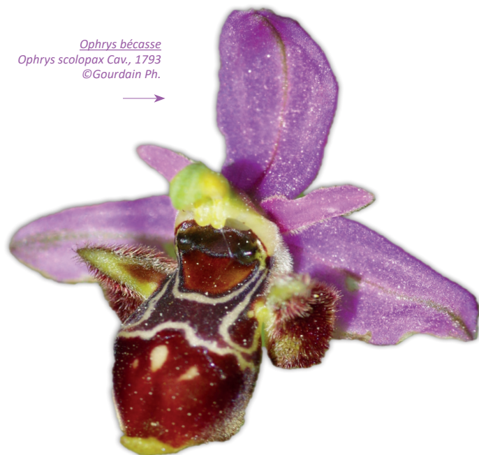
Ophrys bécasse Ophrys scolopax Cav., 1793

Dans le cadre de la mise en place de pratiques respectant les enjeux et objectifs du développement durable (Responsabilité Sociétale de l'Entreprise), la Fondation a organisé à l'automne 2019, pour les membres du club et les employés, un séjour « A la rencontre du Muséum d'histoire naturelle de Paris ». Grâce au partenariat, les salariés de l'Eurl Prince de Provence ont eu le privilège de visiter le Jardin des Plantes et les collections privées du Muséum, au sous-sol de la Grande galerie de l'Évolution, collections non accessibles au grand public. Roches et minéraux, animaux et végétaux naturalisés, fossiles ou vivants, objets préhistoriques, anthropologiques ou encore ethnologiques composent les collections naturalistes du Muséum national d'Histoire naturelle. Au total, 68 millions de spécimens sont conservés et assemblés en collections. Accompagnées des collections documentaires, archivistiques et artistiques, ces collections représentent près de 400 années de connaissances d'histoire naturelle 12 . Ce déplacement inédit a permis aux salariés de mieux connaître le Muséum, partenaire de la FEGVE, et de comprendre les enjeux de la convention, leur offrant ainsi l'opportunité de devenir eux aussi, acteurs de ce partenariat.