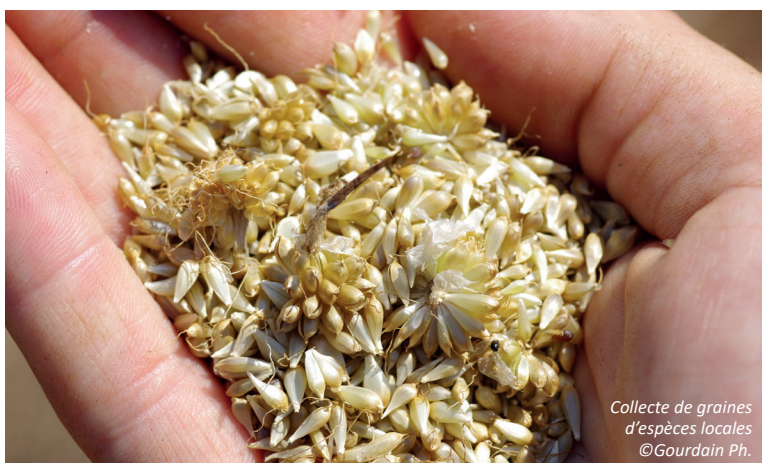
Collecte de graines d'espèces locales