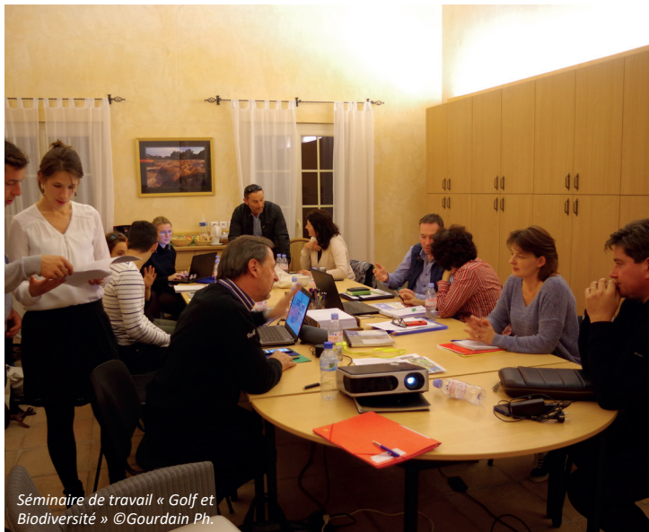
Séminaire de travail « Golf et Biodiversité »