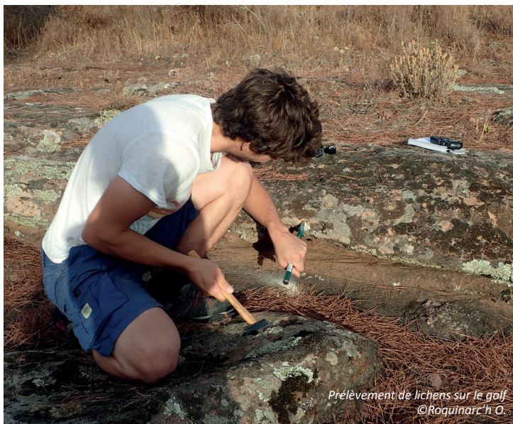
Prélèvement de lichens sur le golf