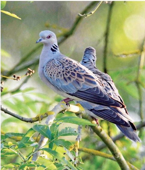
PHOTO 1. – L'estimation de la population nationale de la Tourterelle des bois Streptopelia turtur (environ 437 000 couples en 2009), jugée de bonne qualité mais avec encore une amélioration possible à la marge, a été obtenue grâce à la méthode du « distance sampling ».

A good quality national estimate of Turtle Dove populations was calculated thanks to the "distance sampling" method.