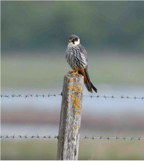
PHOTO 3. – L'estimation de la population nationale du Faucon hobereau Falco subbuteo a été actualisée à environ 9 000 couples (6 950 - 11 830) en 2016-2017 grâce aux tendances fournies par l'observatoire rapaces. Elle est jugée de qualité moyenne.

The national estimate of Hobby populations was updated thanks to the trends available through our birds of prey observatory.