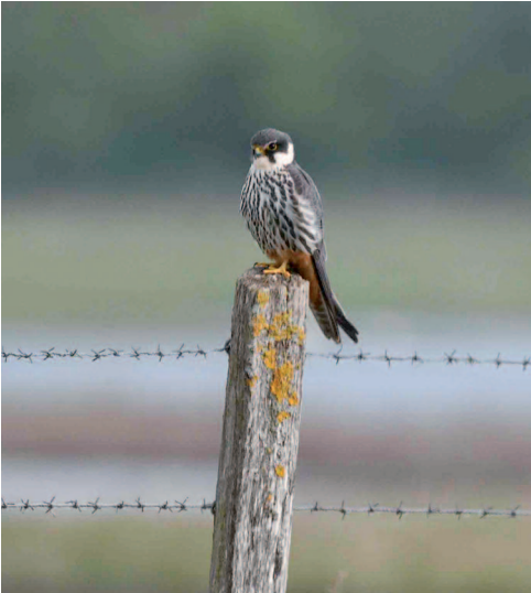
PHOTO 3. – L'estimation de la population nationale du Faucon hobereau Falco subbuteo a été actualisée à environ 9 000 couples (6 950 - 11 830) en 2016-2017 grâce aux tendances fournies par l'observatoire rapaces. Elle est jugée de qualité moyenne.

The national estimate of Hobby populations was updated thanks to the trends available through our birds of prey observatory.