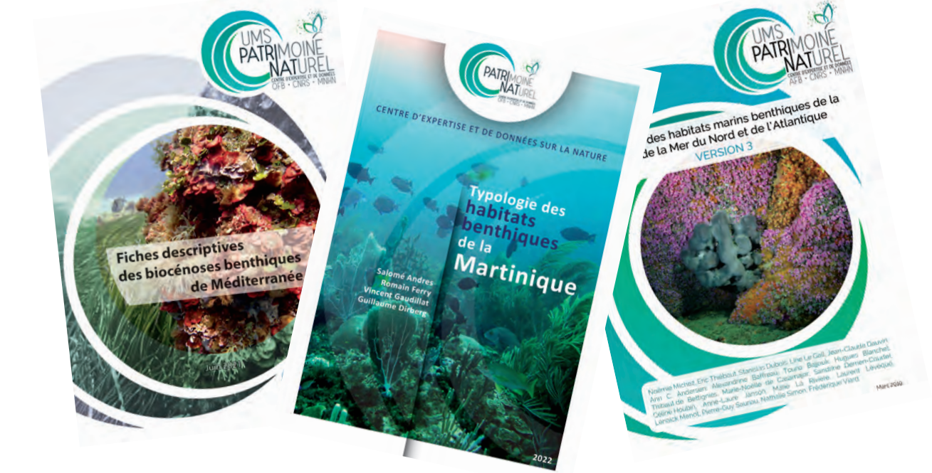
Typologies des habitats marins pour les façades Atlantique-Manche-mer du Nord, Méditerranée et pour la Martinique

◆ Les standards d'échange du SINP : cadres de saisie des jeux de données et des métadonnées associées qui s'appuient sur des ensembles de concepts et d'attributs. Le SINP met à disposition trois standards d'échange pour :