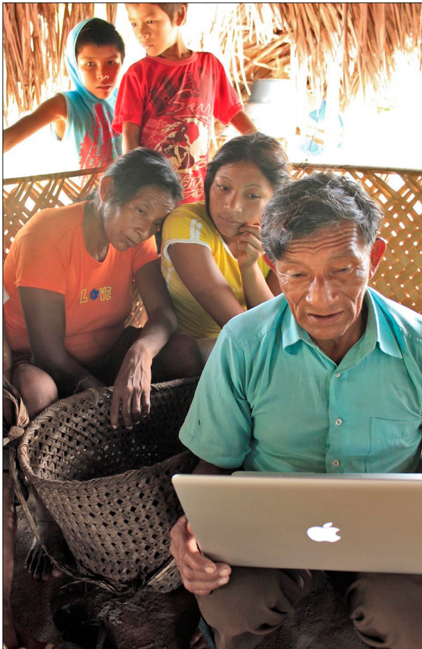
Figura 6. Repatriação digital do acervo Baniwa no rio Ayari, alto rio Negro.

Durante uma viagem de campo ao rio Negro, em 2012, após o trabalho no acervo do MPEG, foi realizada uma atividade de 'repatriação digital' preliminar (Figura 6), deixando um registro fotográfico digital completo do acervo Koch-Grünberg no Museu, coletado entre os Baniwa em cada comunidade visitada, sendo esta atividade geralmente encarregada ao professor da escola indígena (Shepard Jr., 2012). Em cada comunidade, nos reunimos com as lideranças para mostrar as peças do acervo Baniwa e fazer entrevistas sobre o nome, o uso e a fabricação delas. Foi reforçada a observação de que as mais importantes peças rituais tinham sido perdidas há muitas décadas. Alguns poucos ainda sabiam fabricar certas peças. Na comunidade