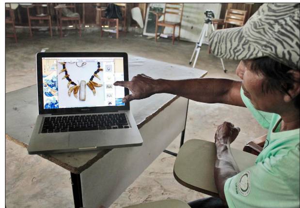
Figura 7. Os colares de cilindro de quartzo e de dentes de onça foram os objetos mais admirados durante o trabalho de repatriação digital.

O diálogo com os Baniwa provocou questionamentos quanto à prática de museologia e uma série de reflexões sobre as rupturas, além das continuidades, com o passado. O intuito do nosso diálogo é o de incentivar um tipo de repatriação que seria mais 'virtual' do que 'física', tomando em conta a fragilidade das peças, incentivando, assim, a produção de novas peças baseadas nos objetos guardados em acervo. Considerando-se o sentimento