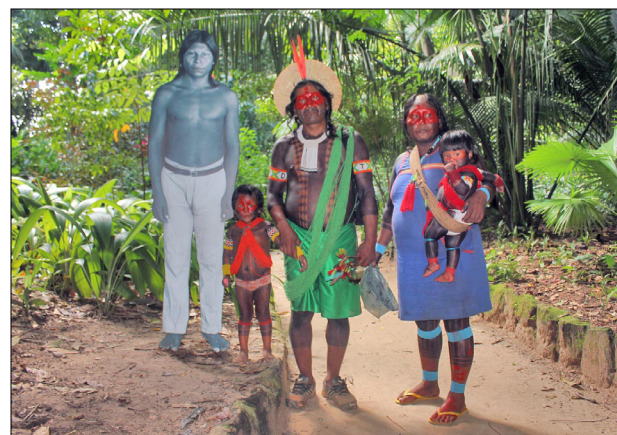
Figura 1. Casal Mebêngôkre-Kayapó no Parque Zoológico do Museu Paraense Emílio Goeldi, Belém, ao lado de uma fotografia em tamanho real de um Irã Amranh que visitou o Museu com Frei Gil, em 1902.

Em 2009-2010, o MPEG e o IRD organizaram uma série de exposições no Brasil e na França, contando com a participação de pesquisadores indígenas e de acadêmicos de ambos os países, incluindo a exposição "Mebêngôkre nhô pyka – Nossa terra Mebêngôkre", realizada em Belém e depois em outras localidades, de forma itinerante (2009-2011); a exposição permanente "Forêt Tropicale",