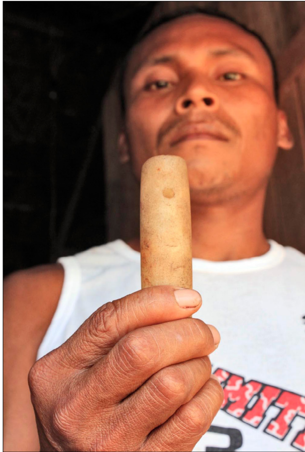
Figura 8. “Meu pai tinha um desses!”: Dzunui (cilindro de quartzo) encontrado em uma das comunidades Baniwa visitadas. Foto: Glenn H. Shepard Jr. (2012).

de pertencimento dos objetos implícito na atitude dos interlocutores e um expresso desconforto com o contexto colonial da aquisição deles, em especial peças consideradas sagradas, o acervo precisa se preparar para futuras demandas de acesso aos objetos e, talvez, solicitações de repatriação.