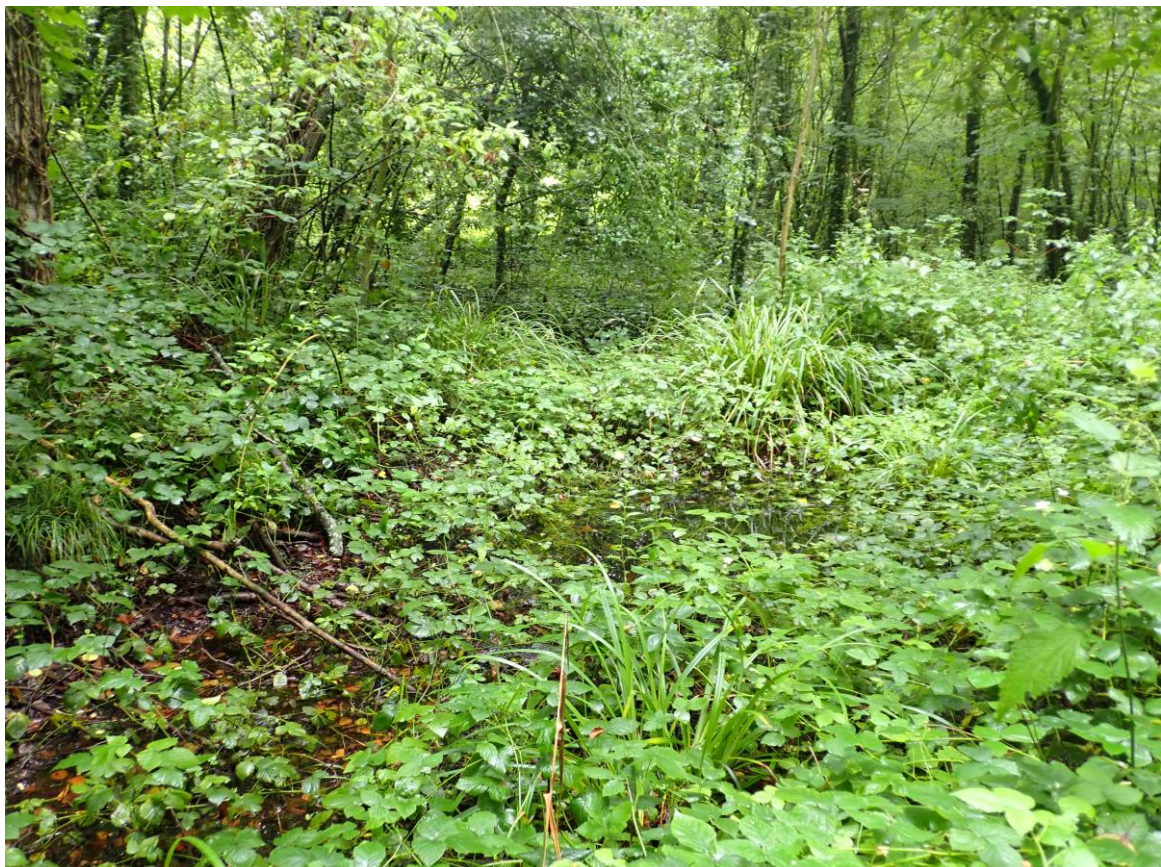
Figure 4 : Photographie de la mare à l'aulne prise en juillet 2021

Intérêt faunistique : La mare à l'aulne, sans intérêt floristique, permet de relier les autres mares entre elles, participant à un corridor écologique important pour les batraciens par exemple.