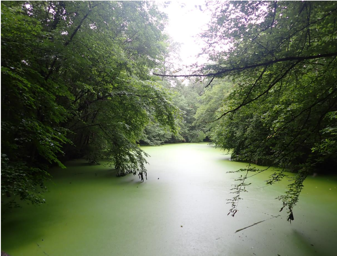
Figure 8 : Photographie de la mare au croissant prise en juillet 2021

Menace : Aucune menace observée. La mare au croissant est floristiquement pauvre mais stable.