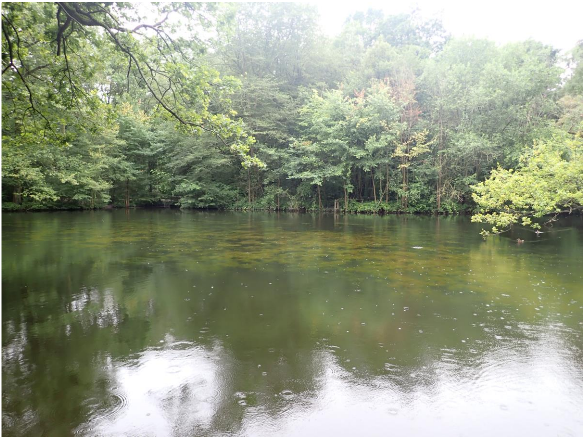
Figure 9 : Photographie de la mare à l'îlot prise en juillet 2021

Menace : La mare à l'îlot paraît stable. Elle pourrait éventuellement être menacée par la colonisation des Lemnacées, présentes dans les autres mares à proximité.