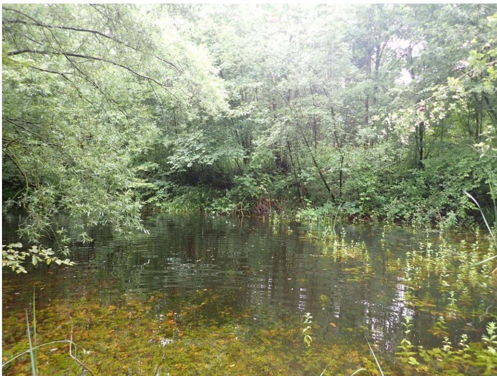
Figure 3 : Photographie de la mare à typhas prise en juillet 2021

Menaces : Les saules, très présents, peuvent rapidement gagner du terrain et accélérer l'atterrissement de la mare.