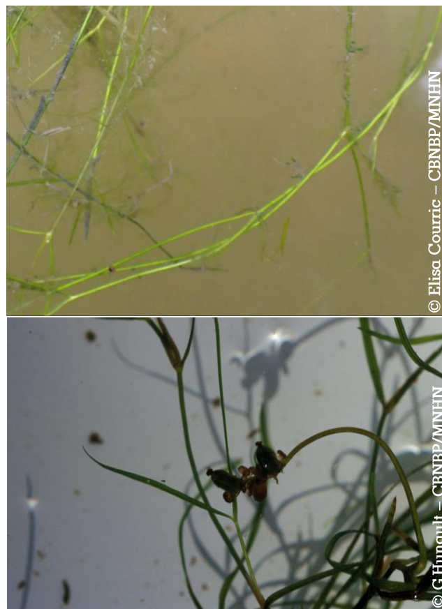
Figure 10 : Photographies de Potamogeton trichoides sur site (en haut) et hors site (en bas).