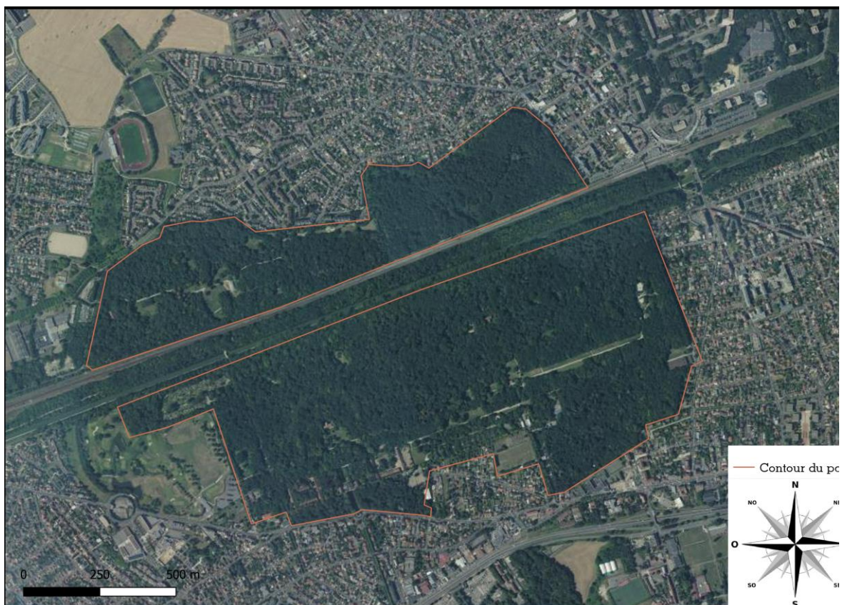
Figure 1 : Contour du parc de la Poudrerie Sevrans

En partenariat avec le Conseil départemental de Seine-Saint-Denis, une étude floristique des mares du parc de la Poudrerie a été réalisée par le Conservatoire botanique national du Bassin parisien (CBNBP) en 2021. Elle a pour objectif principal d'actualiser les connaissances sur les espèces présentes au sein des mares et sur leurs berges. Dans ce rapport, une description de chaque mare et de la végétation inventoriée sur site est faite. Ce diagnostic floristique pourra servir de base de réflexion aux techniciens-gestionnaires du parc de la Poudrerie pour les futurs plans de gestion des mares.