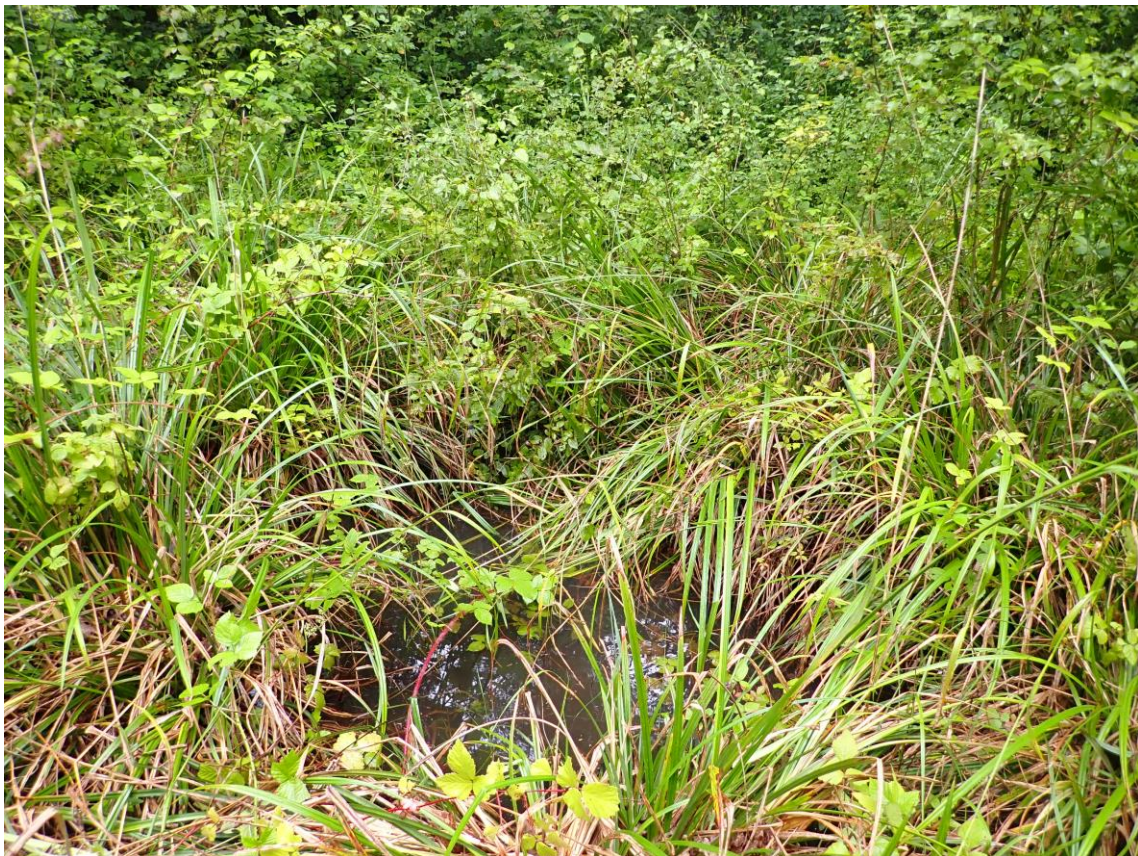
Figure 5 : Photographie du marais prise en juillet 2021

Menaces : Les fourrés plus compétitifs que les mégaphorbiaies risquent de progressivement fermer le milieu.