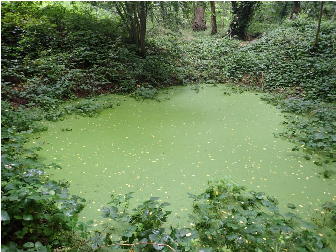
Figure 6 : Photographie de la mare au renard prise en juillet 2021

Menaces : - Si le couvert forestier vient à se développer davantage et bloque la lumière, la survie du tapis de lentilles d'eau pourrait être compromise.