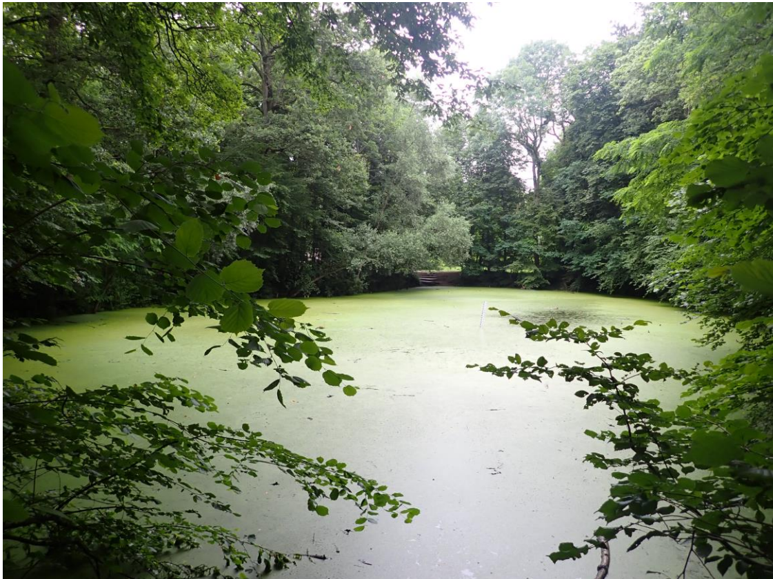
Figure 7 : Photographie de la mare au martin pêcheur prise en juillet 2021

Menace : Aucune menace observée. La mare au martin pêcheur est floristiquement pauvre mais stable.