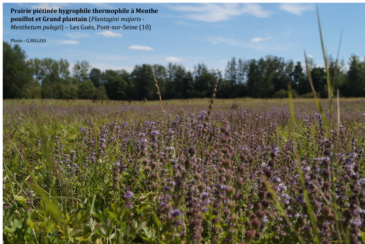
Prairie piétinée hygrophile thermophile à Menthe pouillot et Grand plantain ( Plantagini majoris - Menthetum pulegii ) – Les Gués, Pont-sur-Seine (10)

Certaines végétations patrimoniales, plus mésotrophiles y demeurent quasi-exclusivement : végétations flottantes non enracinées à utriculaire ( Utricularietum australis ), roselière basse à Grande berle ( Rorippo amphibiae – Sietum latifolii ), gazon annuel à Samole de Valérand (groupement à Centaurium pulchellum et Samolus valerandi ), Cariçaies mésotrophiles ( Caricetum elatae et Caricetum vesicariae ), prairies alluviales longuement inondables à Germandrée des marais ( Teucrio scordii – Menthetum arvensis )