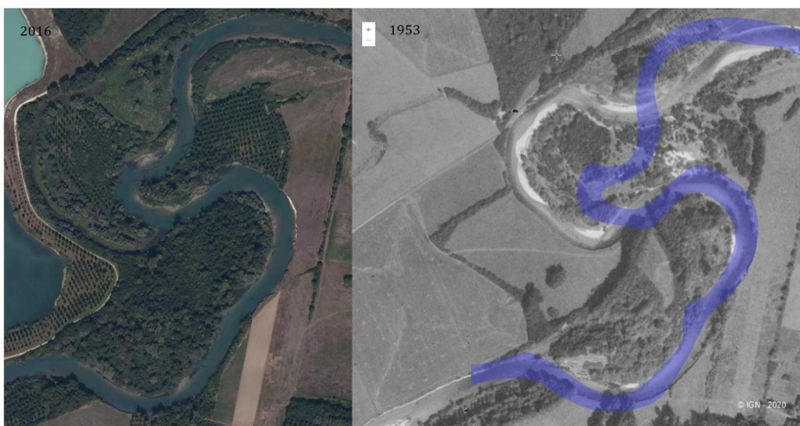
Position spatio-temporelle comparative du lit mineur de la Seine en 1953 et 2016 au lieu-dit « la Soixante » à Crancey (10) Figure 1