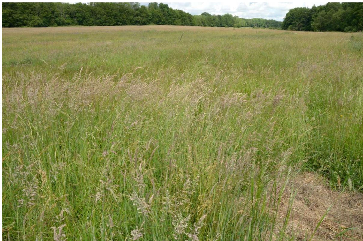
Figure 1 : Aspect général du site 1

Les taxons ayant été contactés lors de la prospection sont les suivants :