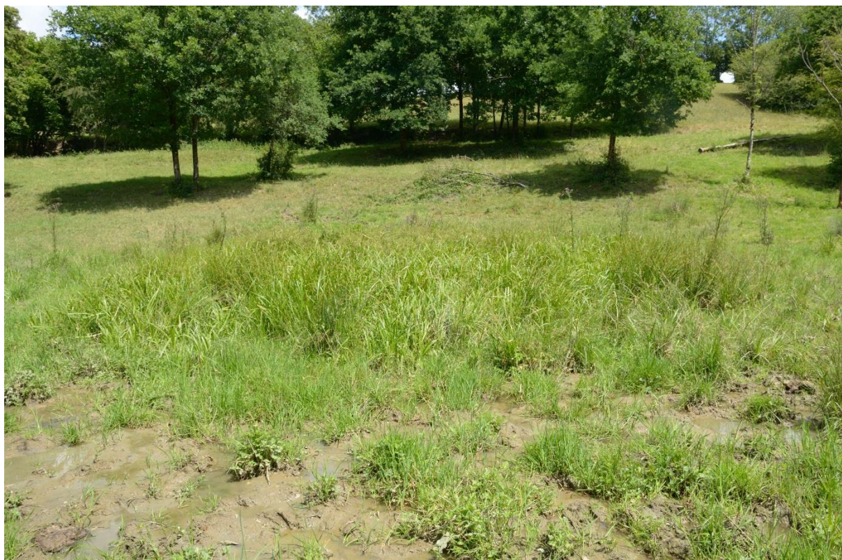
Figure 6 : Aspect général du site 9

Les taxons ayant été contactés lors de la prospection sont les suivants :