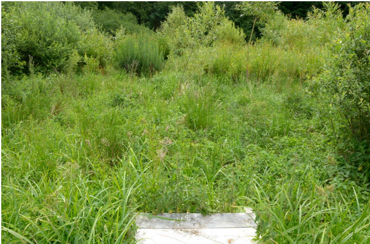
Figure 2 : Aspect général du site 2

Les taxons ayant été contactés lors de la prospection sont les suivants :