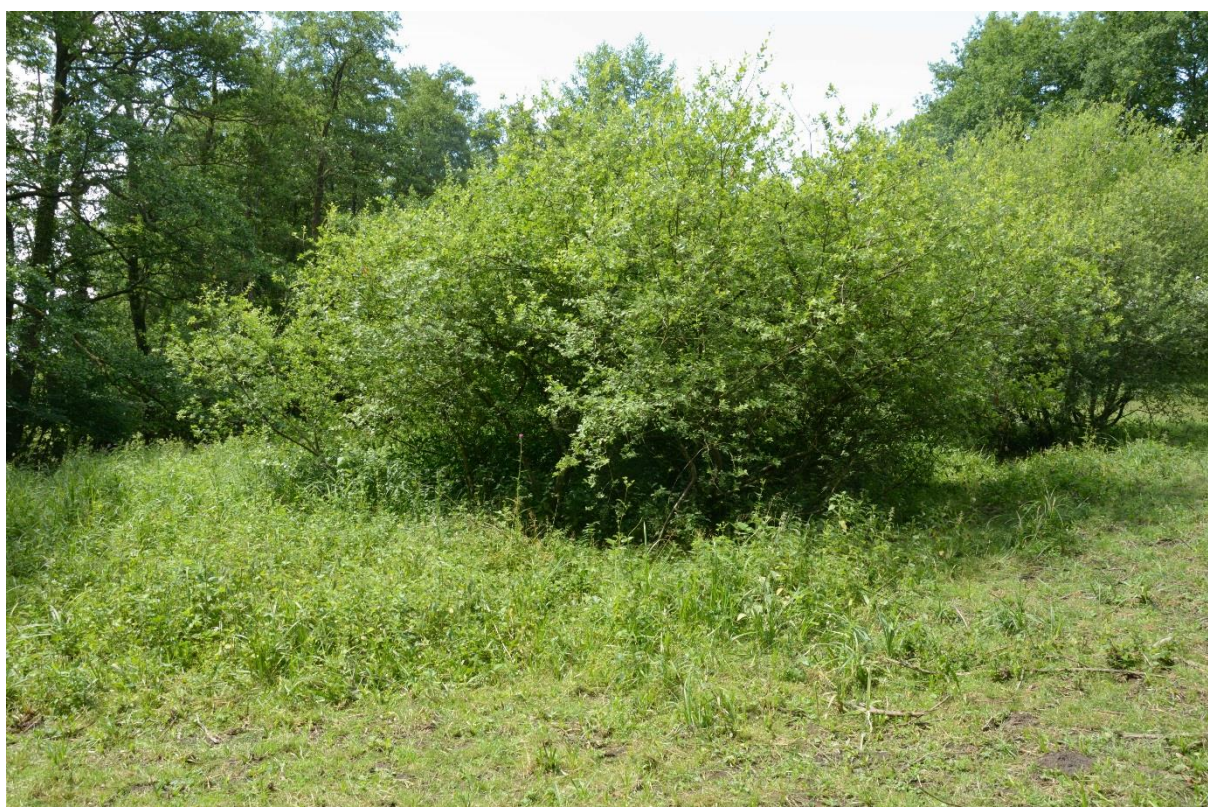
Figure 5 : Aspect général du site 8

Le site est localisé sur la commune de Liart, au lieu-dit Le Frémont, à 330 mètres au nord-est du site 7. Il s'agit d'une cariçaie au sein d'une prairie humide pâturée (figure 5). Les travaux envisagés concernent la création d'une mare sur le site.