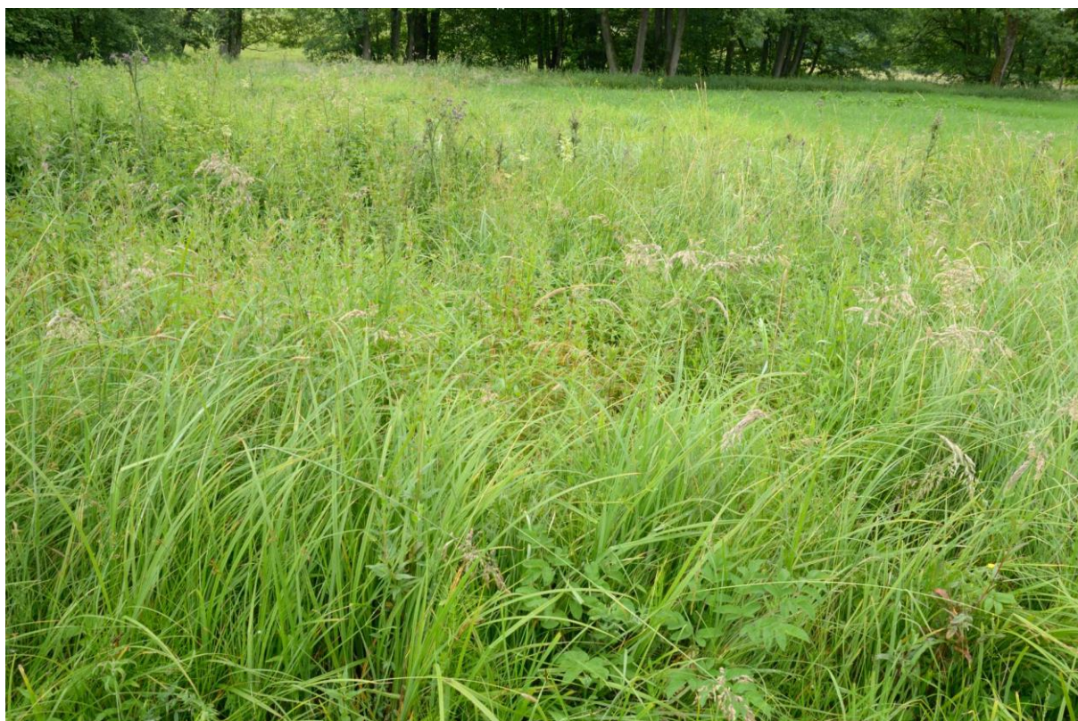
Figure 4 : Aspect général du site 7

Le site est localisé sur la commune de Liart, au lieu-dit Le Frémont, dans une mégaphorbiaie au contact d'une prairie de fauche hygrophile acidophile (figure 4). Les travaux envisagés concernent la création d'une mare sur le site.