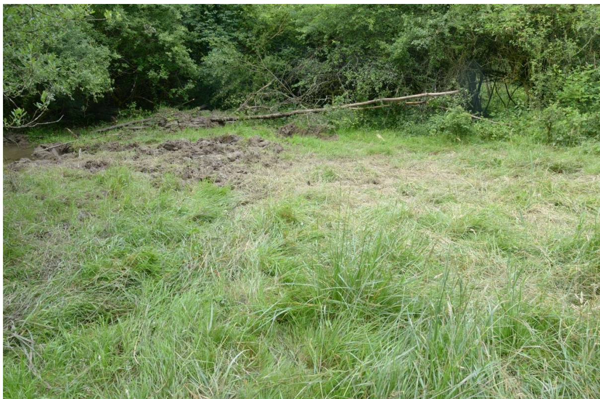
Figure 8 : Aspect général du site 11

Les taxons ayant été contactés lors de la prospection sont les suivants :