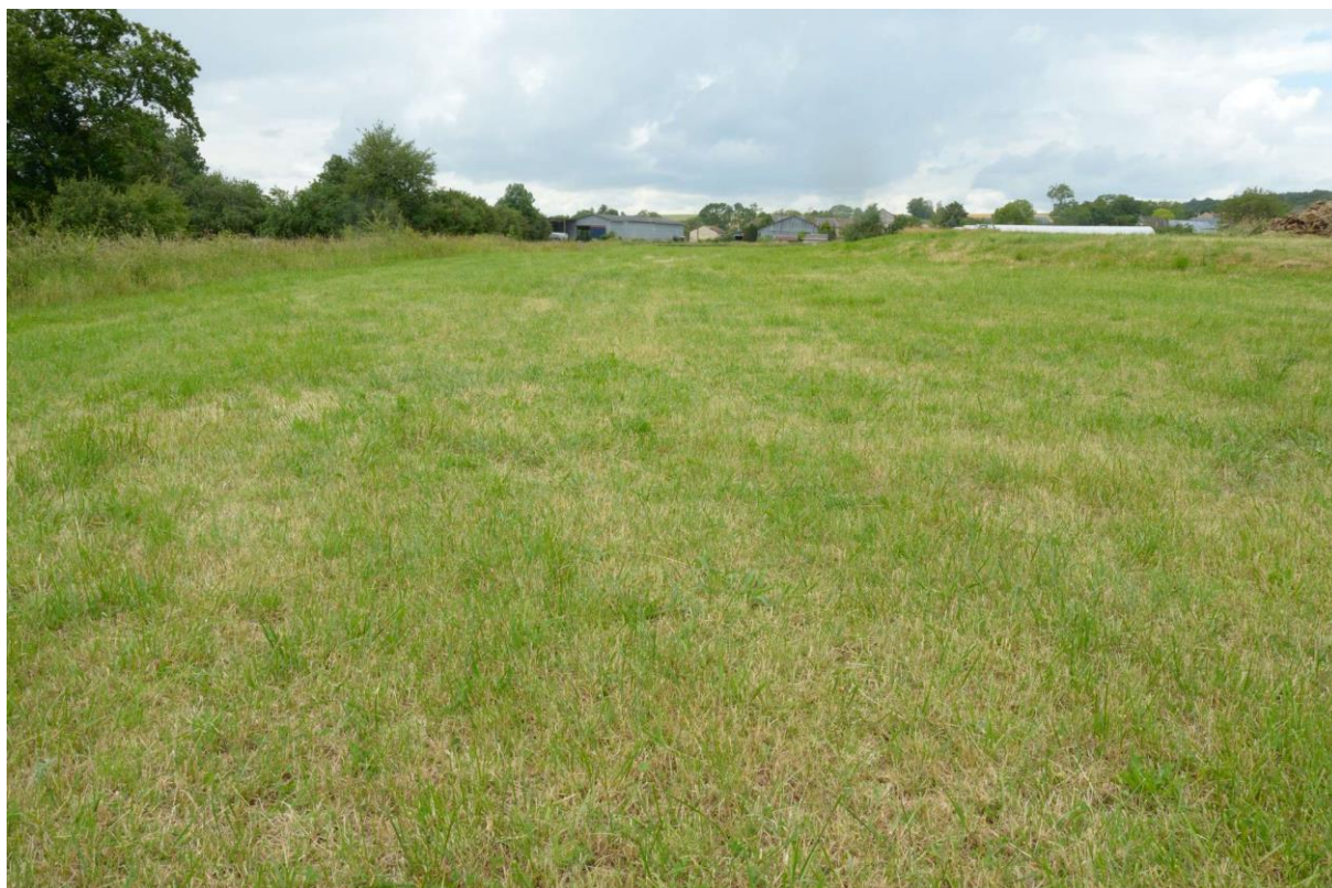
Figure 3 : Aspect général du site 6

Le site est localisé sur la commune de Verrières, dans un contexte de prairie semée à Schedonorus arundinaceus (figure 3). Les travaux envisagés concernent la création d'une mare sur le site.