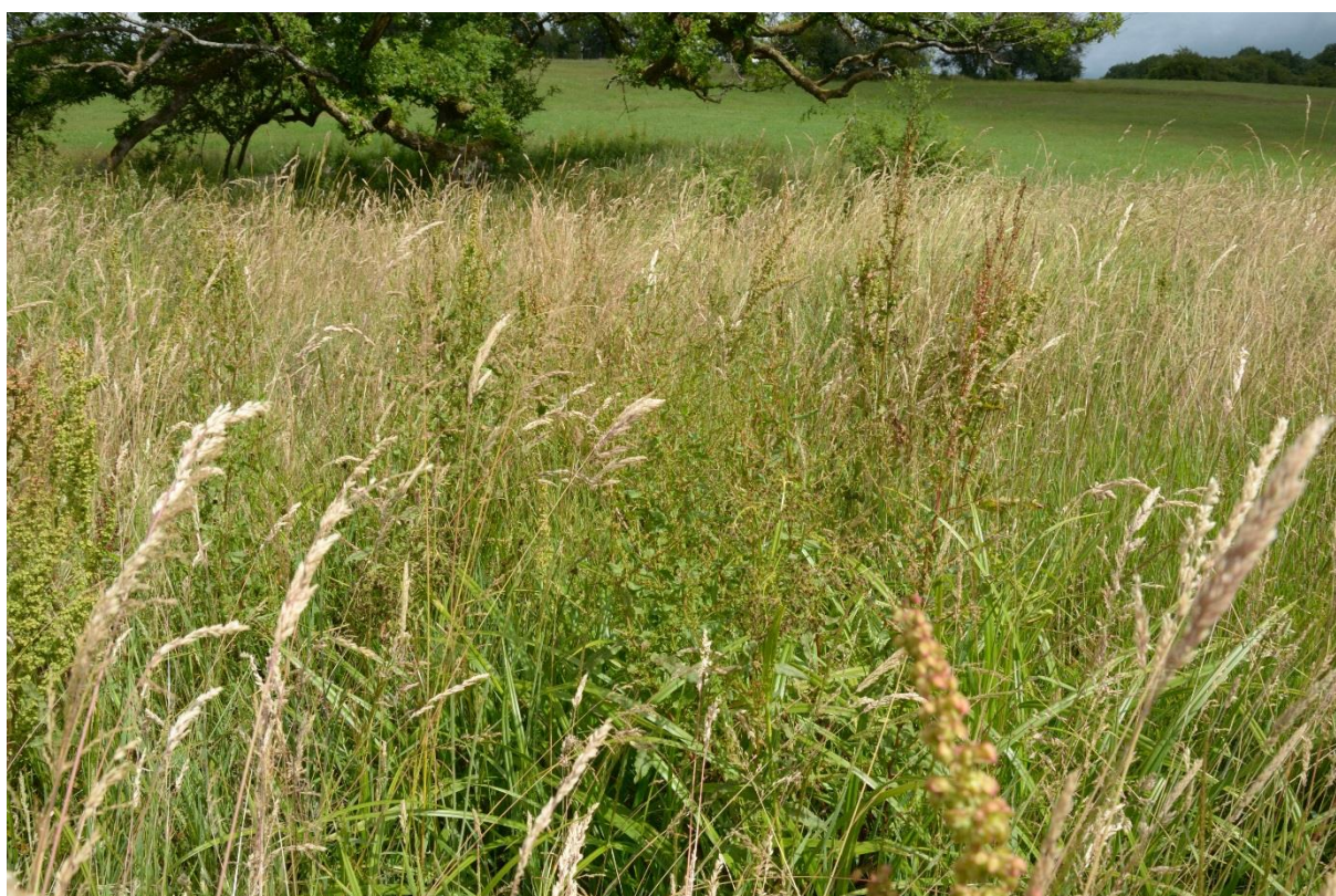
Figure 7 : Aspect général du site 10

Le site est localisé sur la commune de Baâlons, au lieu-dit La Petite Noue, dans une prairie de fauche hygrophile (figure 7). Les travaux envisagés concernent la création d'une mare sur le site.