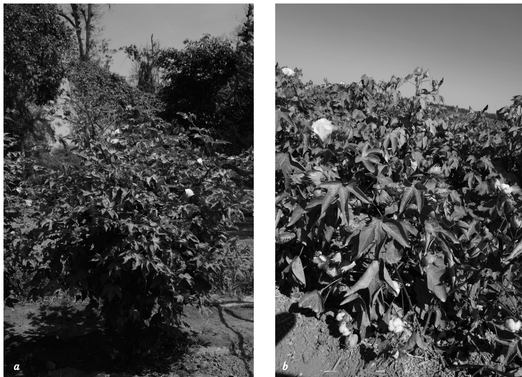
Fig. 1. Coton actuel cultivé sous forme arborée (a. Gossypium barbadense , Pachacamac, Pérou) et herbacé (b. Gossypium arboreum , Las Chapatales, Andalousie, Espagne).

sources écrites, nous nous intéressons aux processus de diffusion d'une plante nouvelle et aux transformations techniques, économiques et sociales qui lui sont associées.