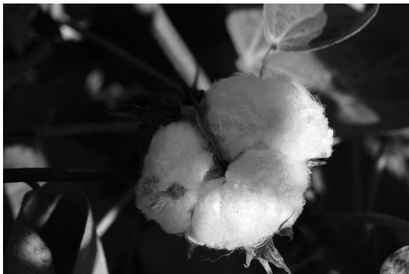
Fig. 3. Fruit du coton (capsule) à maturité ( Gossypium arboreum , Las Chapatales, Andalousie, Espagne).

l'époque moderne à la main, directement ou en roulant un cylindre ou une tige de bois sur les bourres de fibres 33 , vise à séparer les fibres des graines.