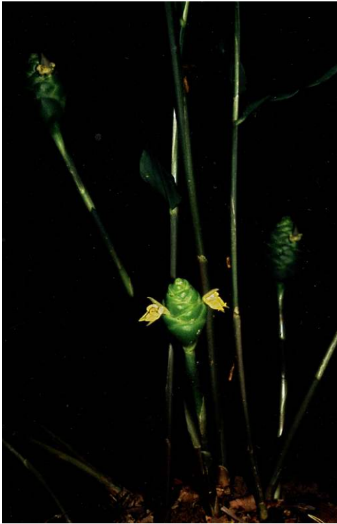
Photo 3. Inflorescence de Zingiber zerumbet