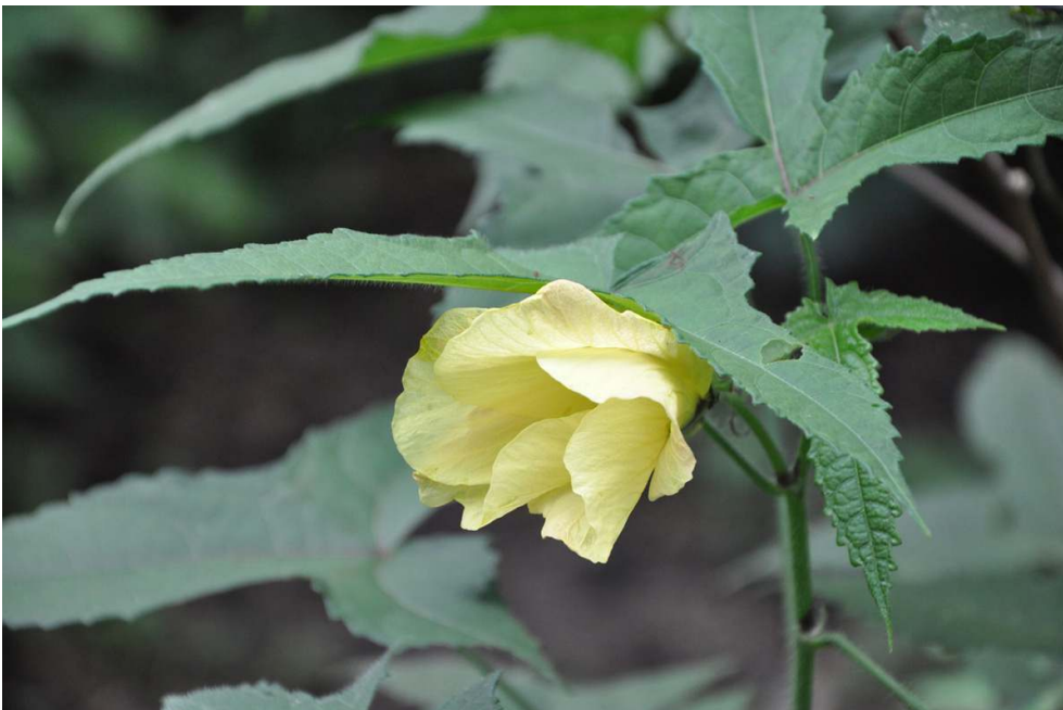
Photo 2. Fleur d' Abelmoschus moschatus