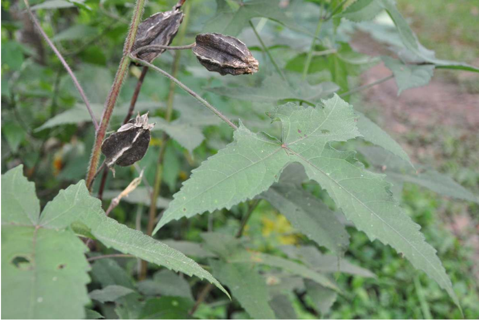
Photo 1. Capsules sèches d' Abelmoschus moschatus ; c'est à ce stade que les graines parfumées sont utilisées

1968 : 103-106). Il s'agit d'une espèce bien individualisée qui n'est jamais confondue avec les espèces alimentaires proches, A. esculentus (L.) Moench et A. manihot (L.) Medik.