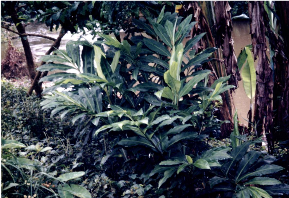
Photo 4. Pied de Zingiber zerumbet en forêt secondaire